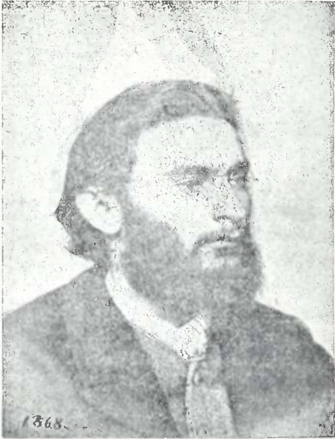
ნოკო ნოკოშვიდი (1868 წ.)