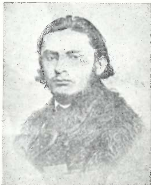
ნოკო ნოკოლაძე (1864 წ.)