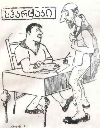
— ჩამწერეთ სპარტაკში, რომ წადვიბრუნო ახალგაზრდობის ჩანი და ამ ყინებს თქვენსეოთ არიფრიდ ვაგდებდ... სპარტაკელი. ჰე!!!