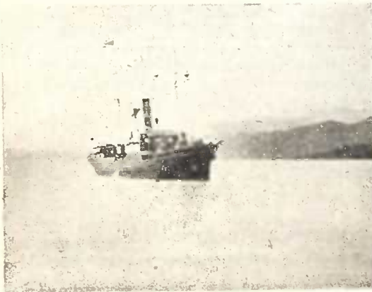
გემის შემოსვლა ბათუმის ნავსადგურში.

ბათუმის ნავსადგური თავისი გეოგრაფიულ მდგომარეობით და ბუნებრივ შესაძლებლობით ერთი საუკეთესო ნავსადგურია შავზღვაზე. ამიტომ გახდა ბათუმი ევროპისა და ცენტრალ. აზიის შემავრთებელ პუნქტათ. ბათუმის ამგვარ მდგომარეობამ გავლენა იქონია ნავსადგურზე, რომელიც თანდათან გაიზარდა, გაფართოვდა და საერთაშორისო მნიშვნელობის ნავსადგურათ გახდა.