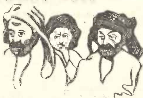
აზარული გლეხები არჩმენავში.