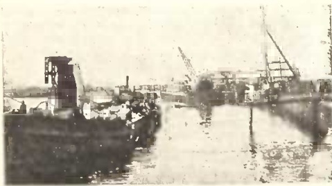
ზღვის ძირის გაწმენდა.

ევროპის ომის და მის შემდეგ ოკუპაციურმა რეჟიმმა შეაჩერა ბათუმის ნავსადგურის ზრდა. უმთავრესი საექსპორტო საქონელი—ნავთბროდუქტები ომის დროს სრულიად არ გადიოდა. მხოლოდ საქართველოს გასაბჭოების შემდეგ გახდა შესაძლებელი ბათუმის ნავსადგურის აღდგენა.