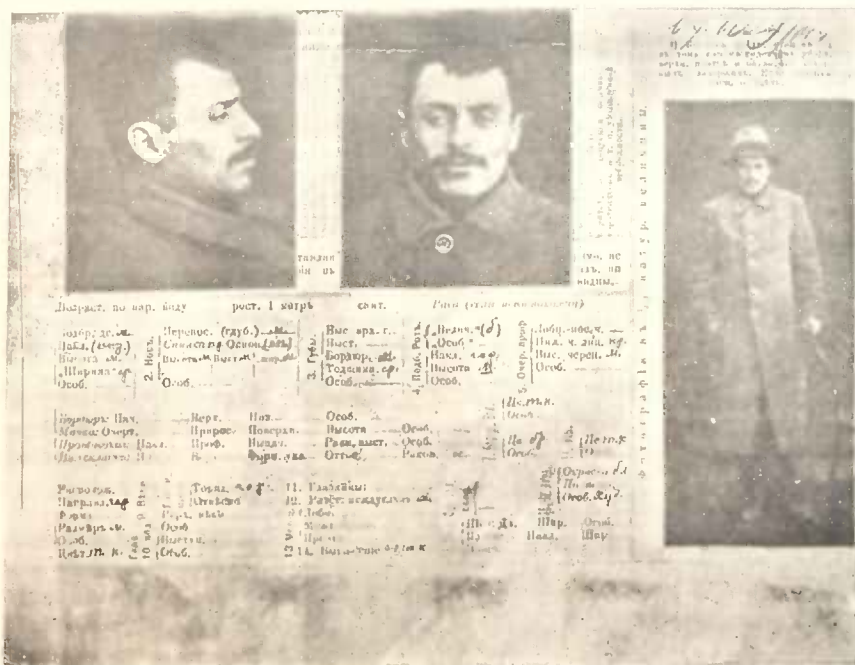
ბ. ვ. ვ. (ბ) აჭარისტანის კომიტეტის ვ/მ. მდივანი ამახ. თენგიზ შავენიძე.