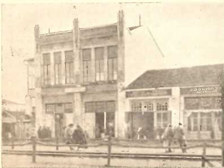
აქარელ გლეხთა სახლი ფსაღი.

გავაცნობთ გერმანიის კინო-მრეწველობას, ამ მიზნით ვისარგებლებთ რუს კინო-მოღვაწის ნიკ. ლებედევის ნაშრომით. ნიკ. ლებედევა თვით დაათვალიერა და შეისწავლა გერმანიის კინო-მრეწველობა და მდიდარი მასალებიც მოაგროვა.