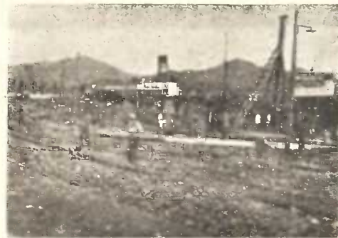
ნავთსაქაჩი მიღების გაყვანა.

აღსანიშნავია, რამ საგარეო ვაჭრობაში ექსპორტი დიდათ სჭარბობს იმპორტს. ექსპორტი იყო—58.276.636 ფ. იმპორტი—5.490.892 ფ. ექსპორტის ასეთი გადაჭარბება აიხსება ნავთბროდუქტების გაზივიტით. გასულ წელს გატანილ იყო 56.902.404 ფ. ეს ციფრი ჯერ კიდევ მცირეა. ნავთბროდუქტების