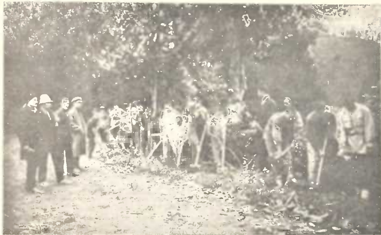
პაპარისტანის ავრონომიული ტანსაცმელი. მუშაობა გაღვი.

დაკავშირებით ფართოდება თვით დაკვირვების და კვლევის არე, სოფელი მაშინ ღიდ სამსახურს გაგვიწევს.