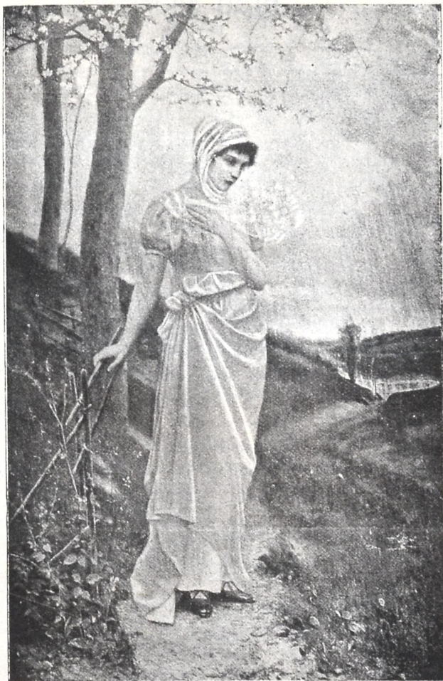
შემოდგომა გარედ და შიგნით! — რიჩინის ნახატი.