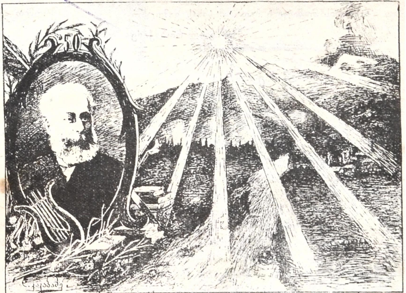
აკაკის 50 წლის იუბილეზე გამო

პუშკინი პირველი სიტყვა ახლად გამოსულ ხალხისა; აკაკი მეორე სიტყვა გაღვიძებულ ხალხისა.