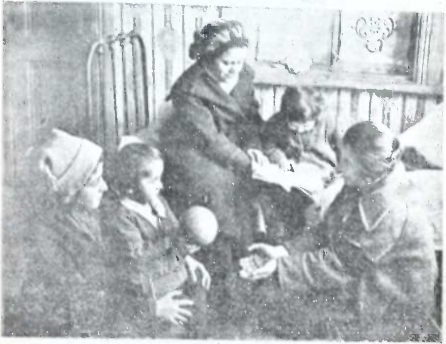
ბორჯომის 7-წლედის მოწაფეები ართობენ ბავშვებს ოჯახში.

მიმდინარე მუშაობამ დაგვანახვა, რომ მცირეწლოვან ბავშთა (1-3 წლ.) მოყვანა საბავშვო ბაღში თუ სკოლაში გართობის მიზნით მიზანშეწონილი არაა, უმჯობესია მათი ოჯახებში შენახვა, უფროსი ჯგუფის მოწაფე გოგონათაგან შემდგარ „მომვლელთა რაზმების“