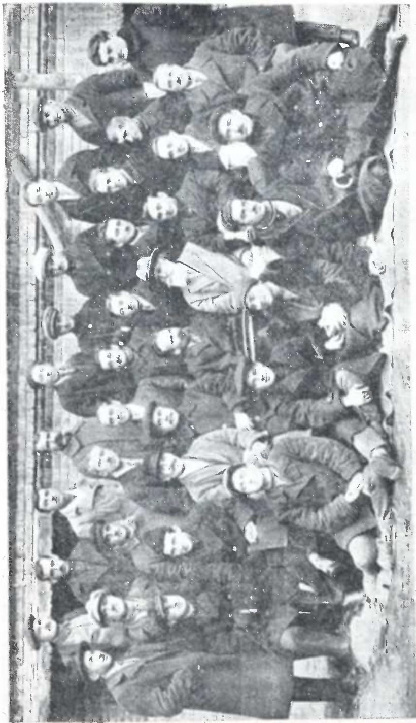
აგრონომიულ ტენიკუმის და სოფლის ახალგაზრდობის სეფლების აგრონომ-მასწავლებელთა კონფერენცია.