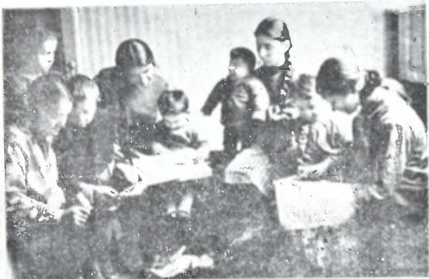
ბორჯომის 7-წლედის მოწაფეები ართობენ ბავშვებს ოჯახში.

აუცილებლად მიმაჩნია შეჩერება იმ ნაკლზე თუ მიღწევაზე, რაიც ამ მუშაობაში გამომეღაენდა, რომ მომავალში საშუალება ექნეს ჩვენს სკოლებს უფრო ორგანიზაციულად დარაზმულნი გამოვიდნენ ამა თუ იმ კამპანიის ჩატარებაში.