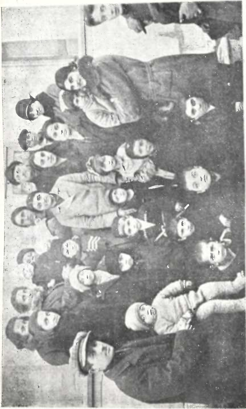
ზაშურის რე. გზ. სკოლა უკვლის ბავშვებს საარჩევნო კრებაზე.