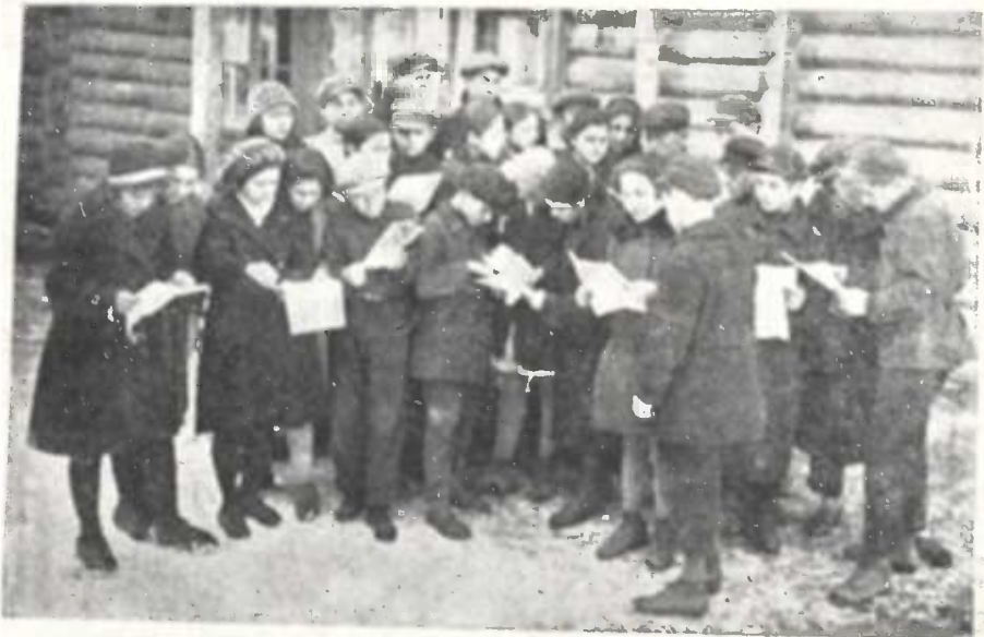
ბორჯომის მუშათა უბნის 7-წლედის მფრინავი რაზმი.

3. მოხსენებების ჩატარება როგორც დაბალ, ისე ზედა ჯგუფებში. მშობლების თანდასწრებით და სათანადო აგიტაციის გაწევით მოსახლეობას შორის, რომ საანგარიშო კრებებს დაესწრონ, მხურვალე მონაწილეობა მიიღონ კამპათში და განწერის დამუშავებაში;