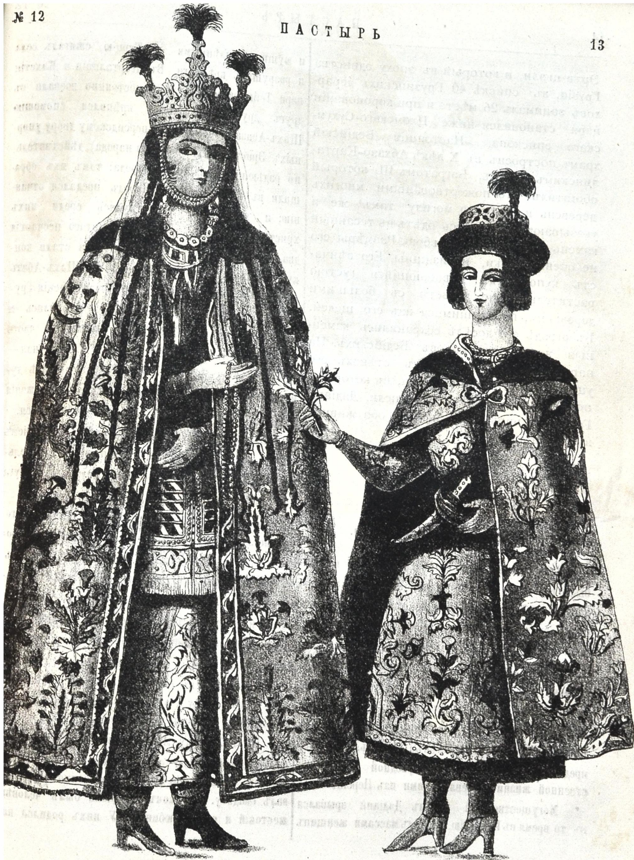
Царица Мариамъ и сынъ ея Отиа.