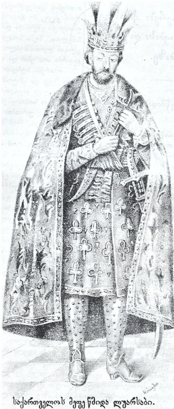
საქართველოს მეფე წმიდა ღუარსაბი.