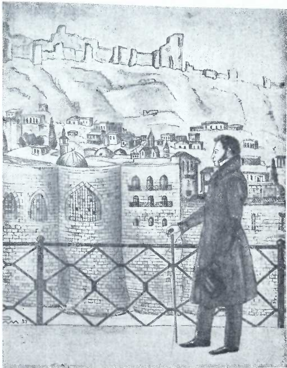
ა. პუშკინი თბილისში