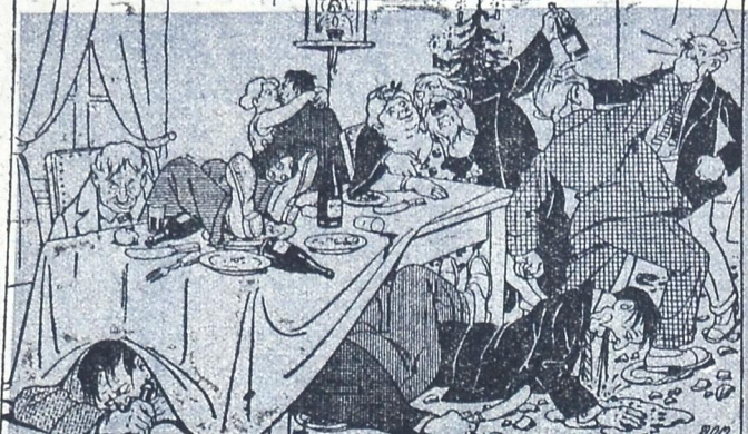
გამენ — სმენ, ერთად ღმირობენ, ჰარაღეს იახიანო, „ქრისტე“ „შობა“ და „ადღვომა“, აი ვის უხარია!