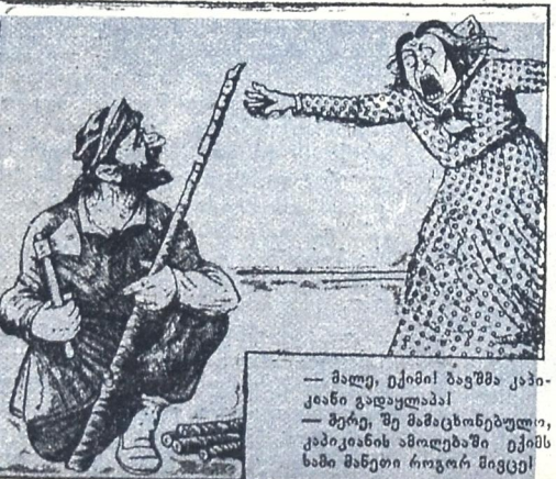
— მალე, ექიმი ზაფშა კაპიკანი გადუკლდა! — შერი, შე მამაცხოვნებელი, კაპიკანის ამოღებაში ექიმს ხაზი მანეთი როგორ მიეცე!

— საკრედიტო ამხანაგობის თავმჯდომარემ, ხუთასი თუმანი ჩაიღო და ისე გაიქცა, რომ ცხენოსანი მილიციაც ვეღარ დაეწევა.