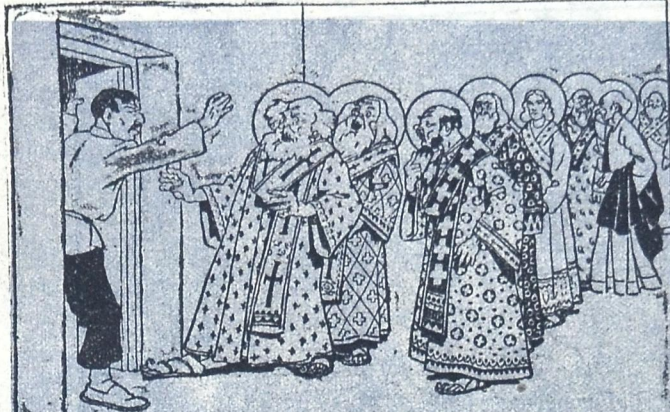
გლსნი: არ გვიღა თქვენი ლოცვა, თქვენისთანა მუქთანორა არცა თქვენი ზიარება. ჩვენთან ნუ, არ იარება.