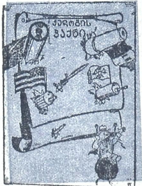
იმპერიალისტები კელოვას პაქტს მშვიდობიანობის დამყა- რების საშუალებათ სთვლიან. მისი წამდელი სახე კი ასეთია.