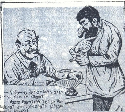
— წინეთაც კურდღლზე დაეჭირეს, რათ არ იშლი? — ძველ მგობარს ზურგი შემაქციე? კლომერტივში გამგეთ ყოფნა სჯობს?

— მე როგორც გლეხკორი, მოვალე ვარ თვალყური ვადევნო ჩვენს თავმჯდომარებს დამე ხომ არ სვამს ღვინოს. დღისით კი ვხედავ, რომ საქმით დატვირთულია და ღვინოს სმისათვის დრო არა აქვს.