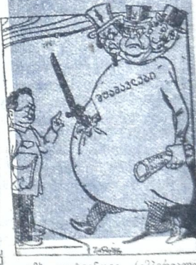
ამხ. ლიტვინოვი (იმპერიალისტ- ტენი) — არ გვინა თქვენისთა- ნა მუშაველები, ხომ იცით ანდ- ნა: შიში ბალაოში არ დაიბა- ლებათ!