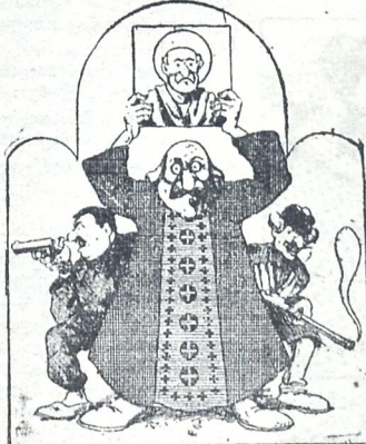
აიბი მცხენილან... არა კაც კლავ... გარდა კოლექტივის წევრისა!