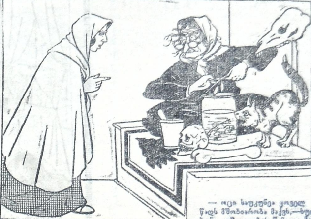
— იცი საუკუნე ყოველ წელს წადს მშობიარობა მაქვს... ხელი იქნის, უშვილობის წაპალი ზომევის!