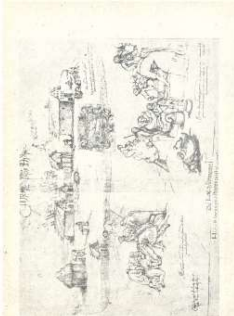
მისიონერების ბინა სამეგრელოში მარცხნივ: პატრი მკურნალობს მაღალ ხიდან ჩამოვარდნილს. მარჯვნივ: პატრი მკურნალობს ბავშვებს. ქრ. კასტელის ალბომიდან (მე-17 ს საქათრველოს მუზეუმი).

ლა თავისი მხლებელი ქალებით; ზამთარი იყო და მიწა სულ დაფარული იყო თოვლით. დედოფალმა დაინახა ერთი გლახაკი, ავადმყოფი და დასუსტებული, სანახევროდ შიშველი; სიცივის გამო ისე აკანკალებული იყო, რომ არ შეეძლო განძრევა, არამცთუ სიარული. აზნაურები და კარის კაცები, რომელნიც ახლდნენ დედოფალს, წინ წასულიყვნენ და დედოფალი თავისი მხლებელი ქალებით რომ მიუახლოვდა იმ საბრალოს, მეტად შეეცოდა იგი და ბრძანა, კარის-კაცებს დაუძახეთ და ერთ-ერთმა მათგანმა ცხენზე შემოისვას ეგ გაჭირვებულიო. ხოლო, რაკი დედოფალმა ნახა, რომ იმათ უძნელდებოდათ მისი ბრძანების აღსრულება ორის მიზეზით: ერთი – რომ ცხენი არ დავღალათო და მეორე – ეთაკილებოდათ ის უბედური, – სრულებითაც არ განრისხდა ასეთი მათი ურჩობისა გამო, არამედ