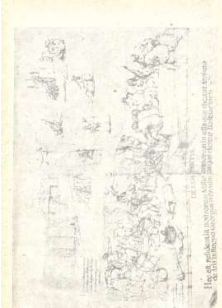
გლეხები სადილობენ მუშაობის შემდეგ უკანა პლანზე: სახლების აგება. ქრ. კასტელის ალბომიდან (მე-17 ს.) საქართველოს მუხეუმი

გამო ოდიშის ერთ ადგილას, რომელსაც გაგიდა (Gaghidas) ჰქვია, მიწას არ ხნავენ გუთნით, რათა არ დაარბილონ და ასე შეუშუშავებულ მიწაში ჩაჰყრიან პურის თესლს, რომელიც კარგად ამოდის და მშვენივრადაც იზრდება, რადგან ამ მაგარ მიწაში კარგად იდგამს ფესვებს და ქარი ისე ადვილად მერ წააქცევს.