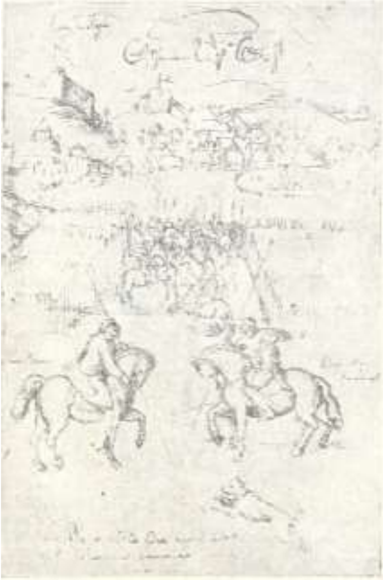
იმერეთის მეფისა და სამეგრელოს მთავრის შეხვედრა ზავის დასადებად ქრ. კასტელის ალბომიდან (მე-17 ს.) საქართველოს მუზეუმი

არა აქვთ, რომ ამ დროს მტერი თავს დაგვეცემოდ, რადგან ჩვეულებად არ აქვთ ღამე ბრძოლა. ამბობენ, რომ ღამე არ ვარგა ბრძოლა, რადგან მტერს შენიანი საგან ვერ გარჩევო და მტრის ვნება რომ გინდოდეს, იქნება შენიანი მოჰკლავო ამის მიუხედავად თავი ფრთხილად უჭითავთ ამ დროსაც. თუმცა დარაჯებს არ აყენებენ ჩვენებურად, მაგრამ ამოირჩევენ ოთხასს ან ხუთასს ცხენოსანს და დაავალებენ რომელისამე თავადის ხელქვეით მთელი ღამე მზის ამოსვლამდე იარონ ბანაკის გარშემო.