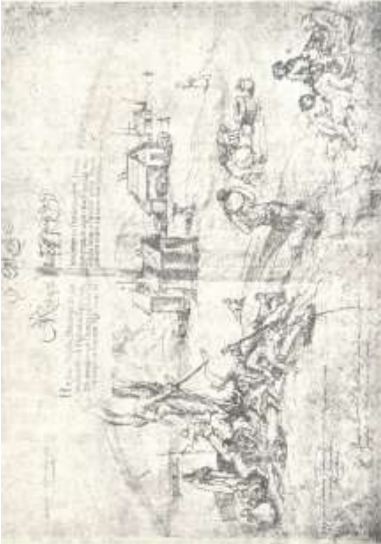
მეგრელები „სამტლოს“ (ძროხას) ჰკლავენ ქრ. კასტელის ალბომიდან (მე-17 ს.) საქართველოს მუზეუმი.

და წყალს აკურთხებს, ხალხი ცდილობს, რაც შეიძლება ჩქარა ამოიღოს დოქებით წყალი, რადგან დარწმუნებულია, რომ თუ ამოღება დაუგვიანდა, ნაკურთხ წყალს მდინარე წაიღებსო. ამიტომაც ვინც უწინ ამოიღებს წყალს, იგი დარწმუნებულია, რომ მისი წყალი უფრო წმიდაა და უფრო სასოებითაც ინახავს ამ წყალსა. ცხენოსნები კი ჩავლენ წყალში, რამდენჯერმე გავლენ და გამოვლენ მდინარეში იმის იმედით, რომ ამ ნაკურთხი წყალის მეოხებით ღმერთი მთელი წლის განმავლობაში აღარაფერს არ გაუჭირვებს ჩვენს ცხენებსაო. წყლის კურთხევას რომ დაასრულებენ, იმავე წესით ყველანი დაბრუნდებიან ეკლესიაში და იქიდან წავლენ თავიანთ სახლებში, რათა ეს დღე იდღესასწაულონ ჩვეულებრივი ნადიმის გამართვით და საღამომდე ჭამა-სმაში დროს გატარებით.