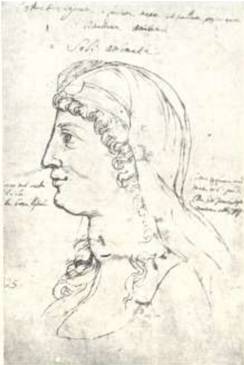
მეგრელი გლეხის ქალი ქრ. კასტელის ალბომიდან (მე-17 ს.) საქართველოს მუზეუმი.

სავებიც და ამ წვეულებაში სასიძომ უნდა მიაღწევას ნიშნად თავის საცოლეს ან ვერცხლის თასი, ან ბეჭედი, და ან ოქროს ფული. ამით ნიშნობა სრულდება. ვიდრე სარძლო მშობლების სახლში იმყოფება, სასიძომ ყოველ მოსვლაზე უნდა მოიყვანოს თან რამდენიმე ხარი და მოიტანოს ბლომად ღვინო და საჭმელები. ყოველსავე ამას იმავე დღეს გაათავებენ, რადგან დიდ წვეულებას გამართავენ, რომელზედაც მოიწვევენ ახლობელ ნათესავებს და მეგობრებს. ამ შემთხვევაში, კარგად აღზრდილი ქალები სასიძოს კიდევ რომ შეხვდნენ პირისპირ, მაინც თვალს არ ასწვენ და არ შეხედვენ, რათა ამით თავის მორცხვობა დაამტკიცონ. ხოლო თუ სასიძო არ მოეშვა და