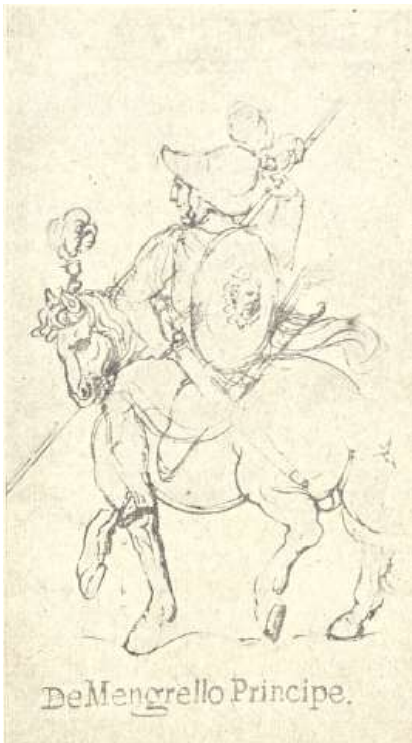
ლევან დადიანი სამეგრელოს მთავარი 1611-57 წ. წ. ქრისტეფორე კასტელის ალბომიდან (მე-17 ს. საქართველოს მუზეუმი).

ჯდარად მოიქცა მის შესახებ და დაკმაყოფილდა მით, რომ დაატუსაღა და გადასცა გურიის მთავარს, თავის ბიძაშვილს, რათა შე-