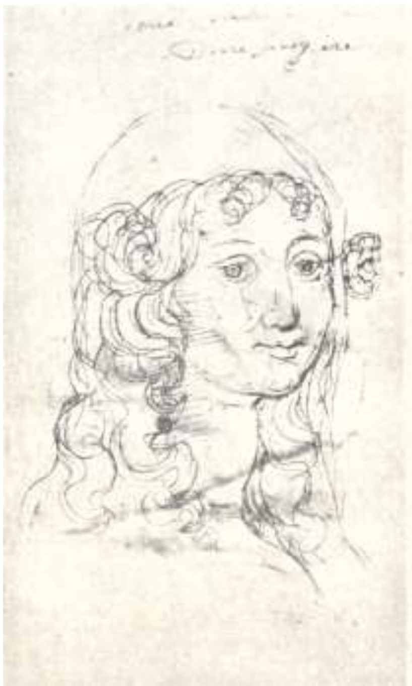
მეგრელი გლეხის ქალი ქრ. კასტელის ალბომიდან (მე-176.) საქართველოს მუზეუმი.