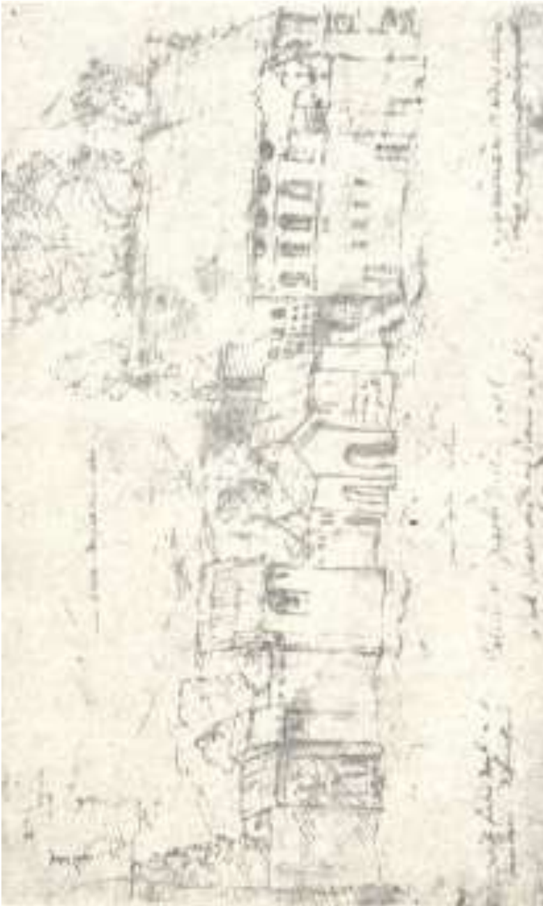
სამეგრელოს მთავრის სასახლე ზუგდიდში ქრისტეფორე კასტელის ალბომიდან (მე-17 ს.) საქართველოს მუზეუმი

აღვწერთ ეხლა მეგრელების კარ-მიდამო. ავღნიშნოთ ჯერ, რომ ყოველ მეგრელს ისე დიდი ეზო აქვს, რომ უფრო მინდორს წარ-