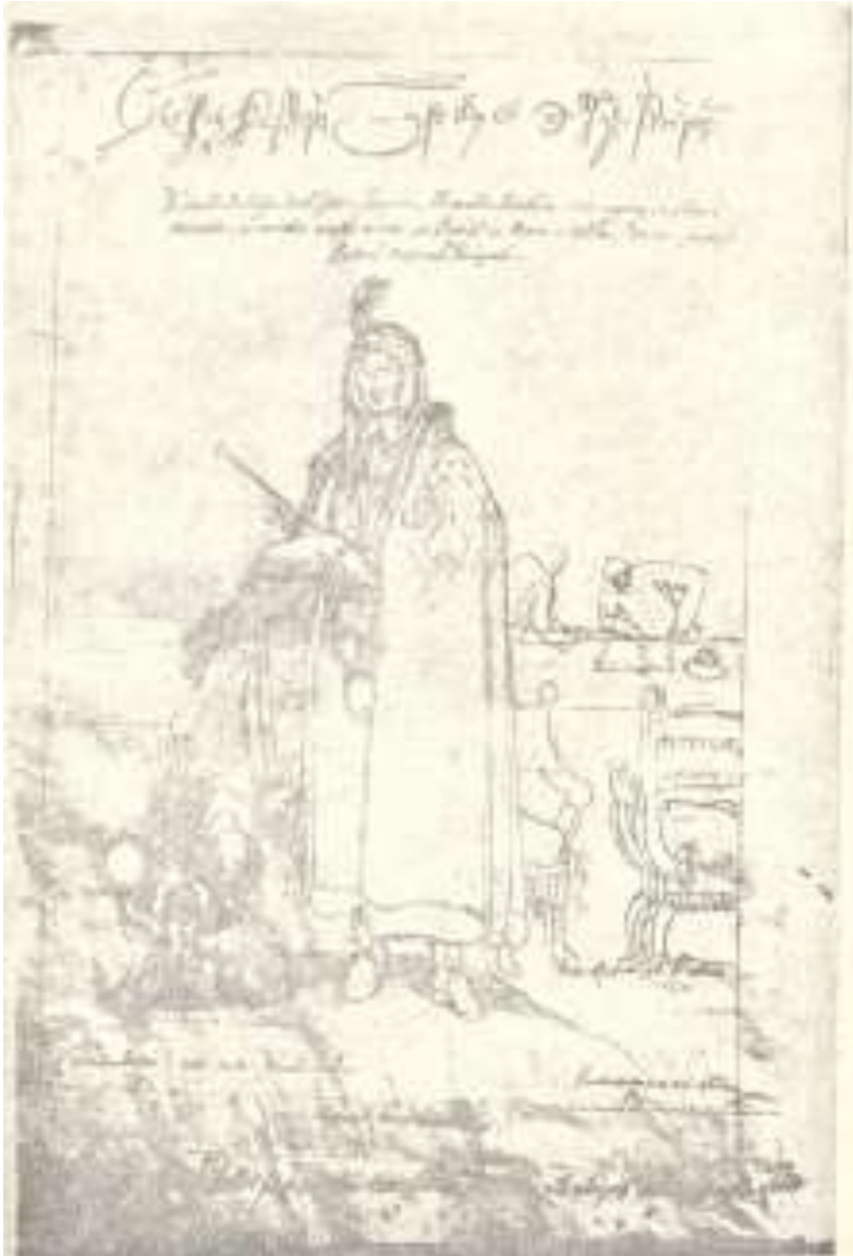
მაღალი წოდების ქალი ქრ. კასტელის ალბომიდან (მე-17 ს.). საქართველოს მუზეუმი

და ყურთმაჯები მიწამდის უწვდება. ეს ტანისამოსი მეტად მშვენიერია, როგორც მოყვანილობით, აგრეთვე მდიდრულის ქსოვილით, რომლისგანაც იკერება. ჰკერავენ ამ ტანისამოსს დამასკის ქსოვილი-სა, ან ხავერდისა და ფარჩისაგან; სარჩულად უდებენ სიასამურის ტყავს და მაღლიდან ქვედამდი შემკულია ოქროს ან მარგალიტის ღილებით. ყოველ თავად-აზნაურს ამისთანა ტანისამოსი რამდენიმე აქვს სხვა-და-სხვა ქსოვილისა, რომ გარემოებისამებრ ან ერთი ჩაიცვას, ან მეორე. ეს ტანისამოსი საერთოა როგორც კაცებისათვის, ისე ქალებისათვის.