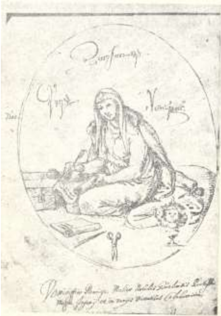
მაღალი წოდების ქალი ქრ. კასტელის ალბომიდან (მე-17 ს.). საქართველოს მუზეუმი

ლომი, ჩამოურიგებს ბატონთან ახლო მჯდომ სტუმრებს პატარა ჩოგნით ცოტაოდენს იმ თეთრ ღომს, ვითომც დასამატად იმ ჩვეულებრივის ღომისა, რომელიც მათ სხვებთან ერთად დაურიგდათ.