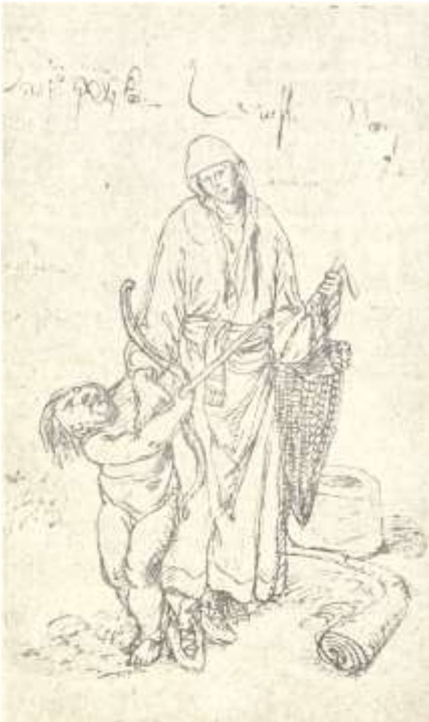
მეგრელი გლეხის ქალი ქრ. კასტელის ალბომიდან (მე-17 ს.) საქართველოს მუზეუმი