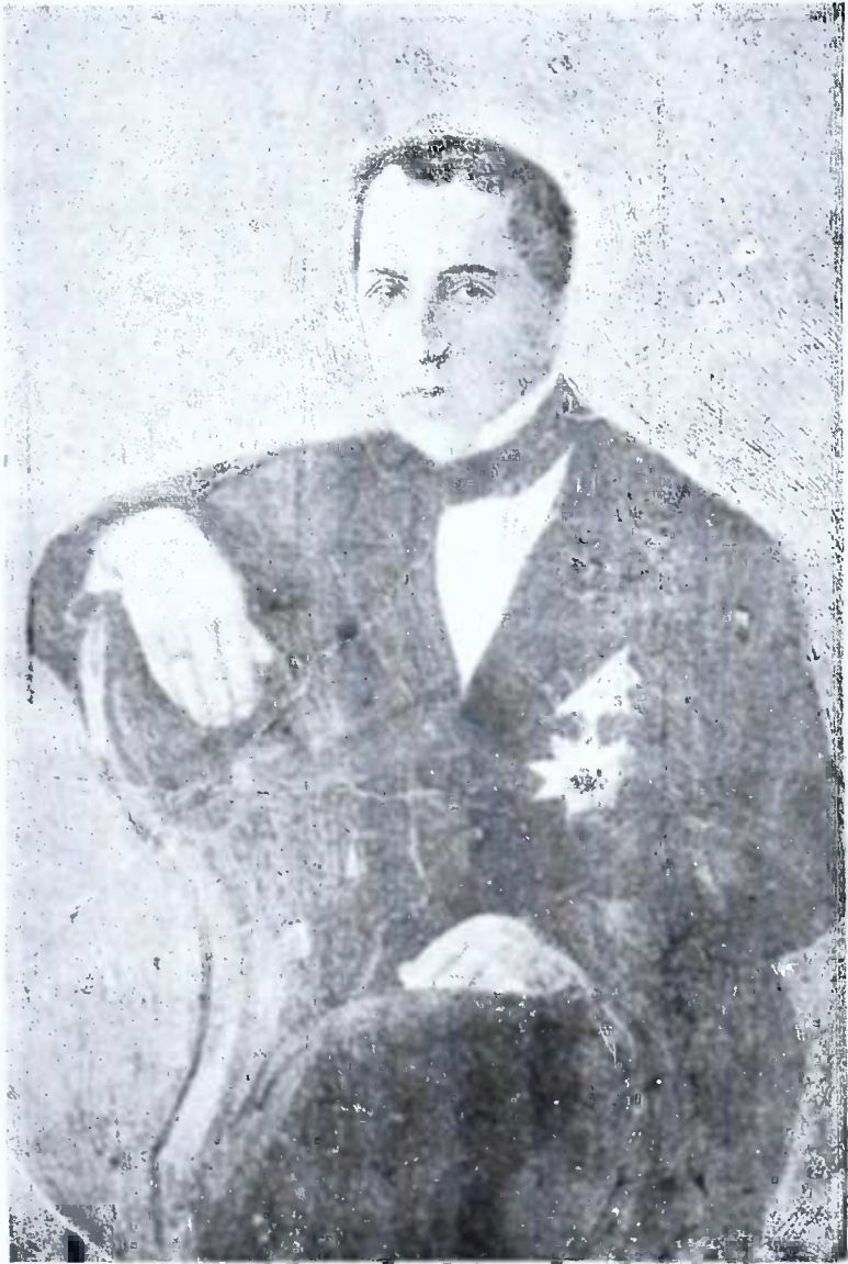
Ը. ԿԻՍՅԱՆԻ ՆՏԱԼՅԱՆՇՐՋԼՈՒՄԿ