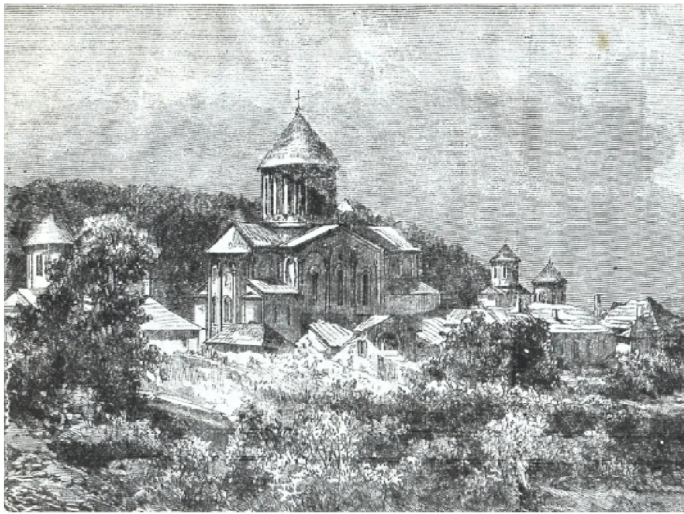
Общій видъ Гаенатскаго монастыря.