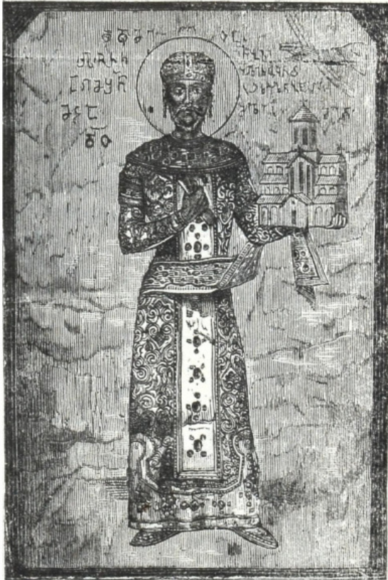
Царь Давидъ Возобновитель.