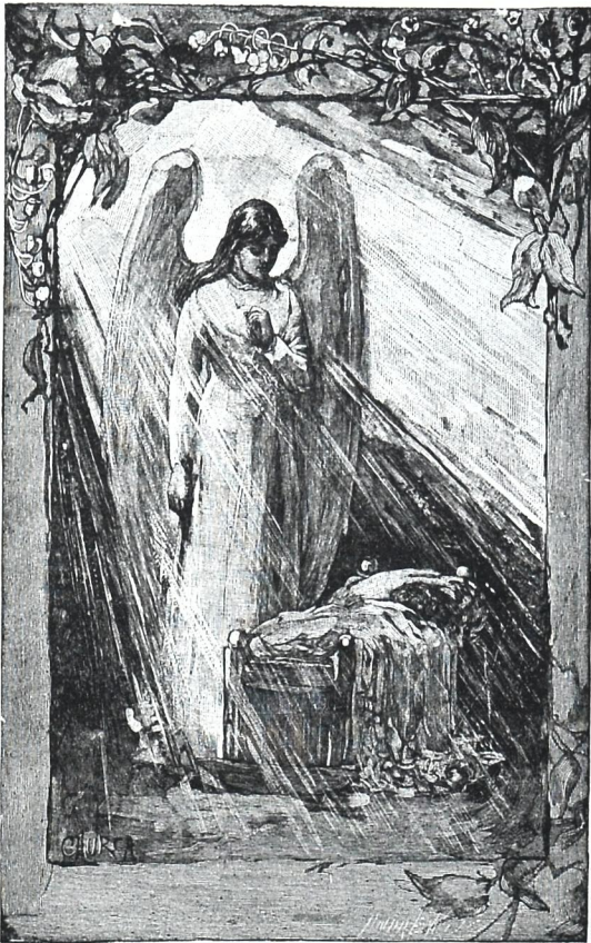
აღდგომისა შენსა, ქრისტე მაცხოვარო, გუფით წმიდით კეკეუბით, დიდება შენდა!

რამოძესათვის ევოლიუციის სარჩული დაეღვა. იკითხავთ, ნუ თუ ამით ძანძმა დაკარგა თავისი ძონ-ძური თვისება? სრულებითაც არა. თუ კიდევ უფრო არ გამოაშკარავდა ეს უკანასკნელი თვისება. ასე მოუვიდა ბრუნნეტიერის ევოლიუციონურ მეტაფი-ზიკას. ამასთანვე გამომქლანდა კიდევ ერთი ბრუნ-ნეტიერისათვის არა სასიამოვნო გარემოება.