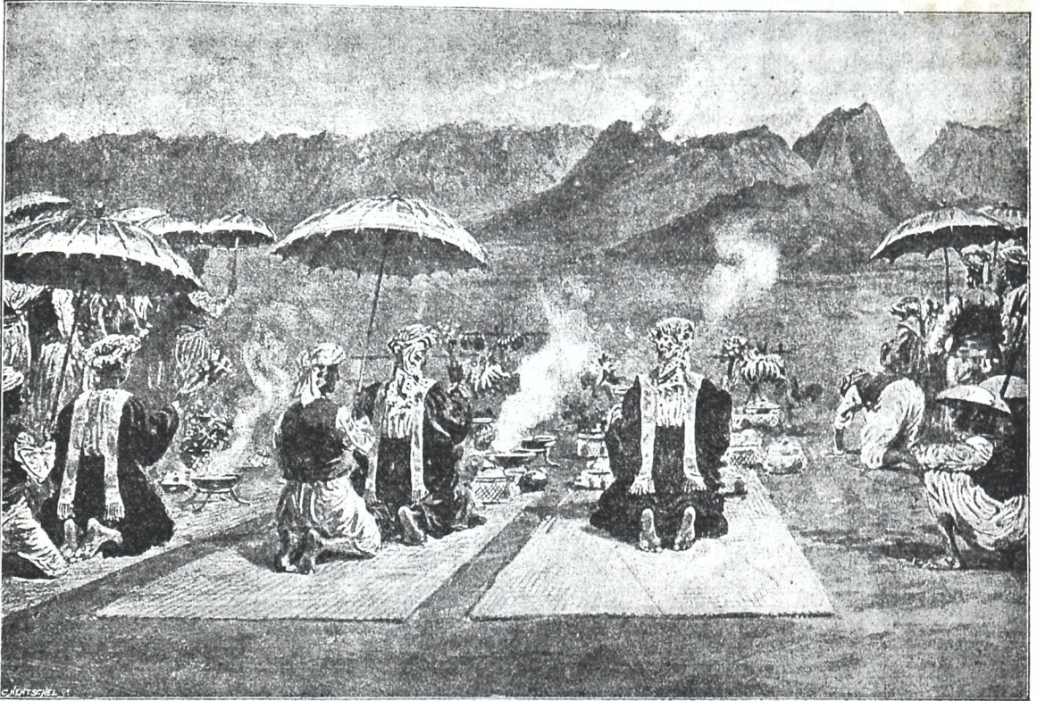
ბრამინების ლოცვა ვულკანის წინაშე.