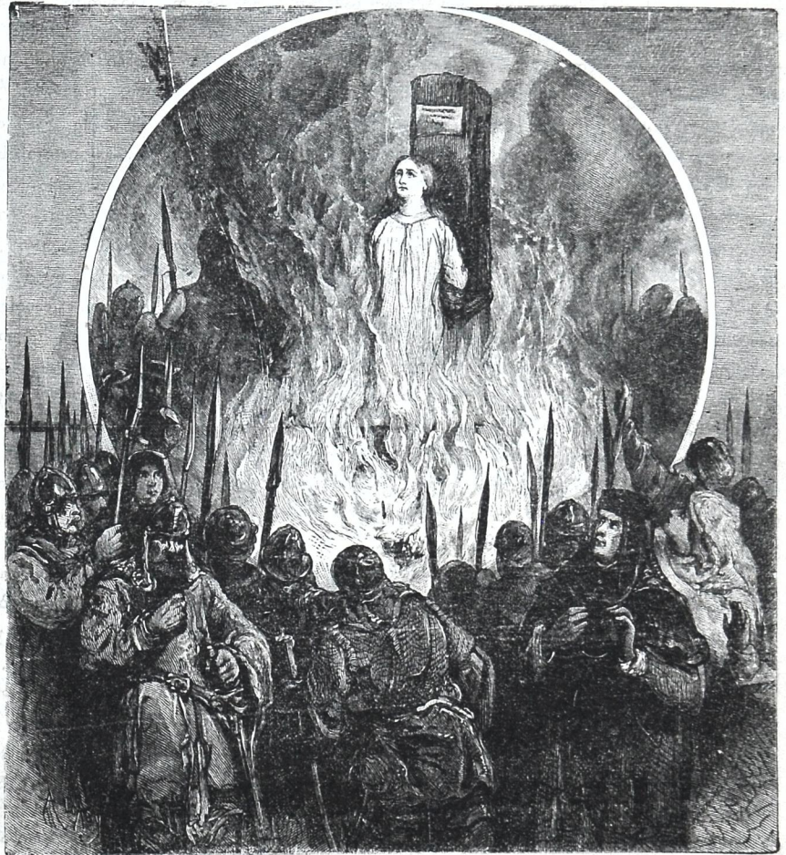
ყ ა ნ დ ა რ კ ი ს ცეცხლით დასჯა.

თითქმის მთელი წელიწადი იყო ქან დარკი დატყვევებული, და ამ ხნის განმავლობაში იმდენი დამცირება და შეწუხება აიტანა, რომ სხვა მის ადვილს ჰკუიდან შეცდებოდა. მძიმე ჯაქვით ხელ ფეხ შეკრულ ქალს დღე და ღამე თავს ადგა ხუთი მცეელი, რომელნიც მოურიდებლათ ექცეოდნენ მას და რამდენჯერმე უნდოდათ მისი გაუბატურება. ამ განსაცდელსაგან ერთხელ გადაარჩინა თვით გრაფმა ვარეკმა, რომელმაც გაიგონა ქალის კიეილი; მაგრამ გრაფის საკციელი, რასაკვირველია, მხოლოდ მითი აიხსნება, რომ მას სულ სხვა გვართ უნდოდა ქანას დასჯა. ინგლისელებს ძვირათ უღირდათ ქანა და ყოველგვარ ღონისძიებას ხმარობდნენ,