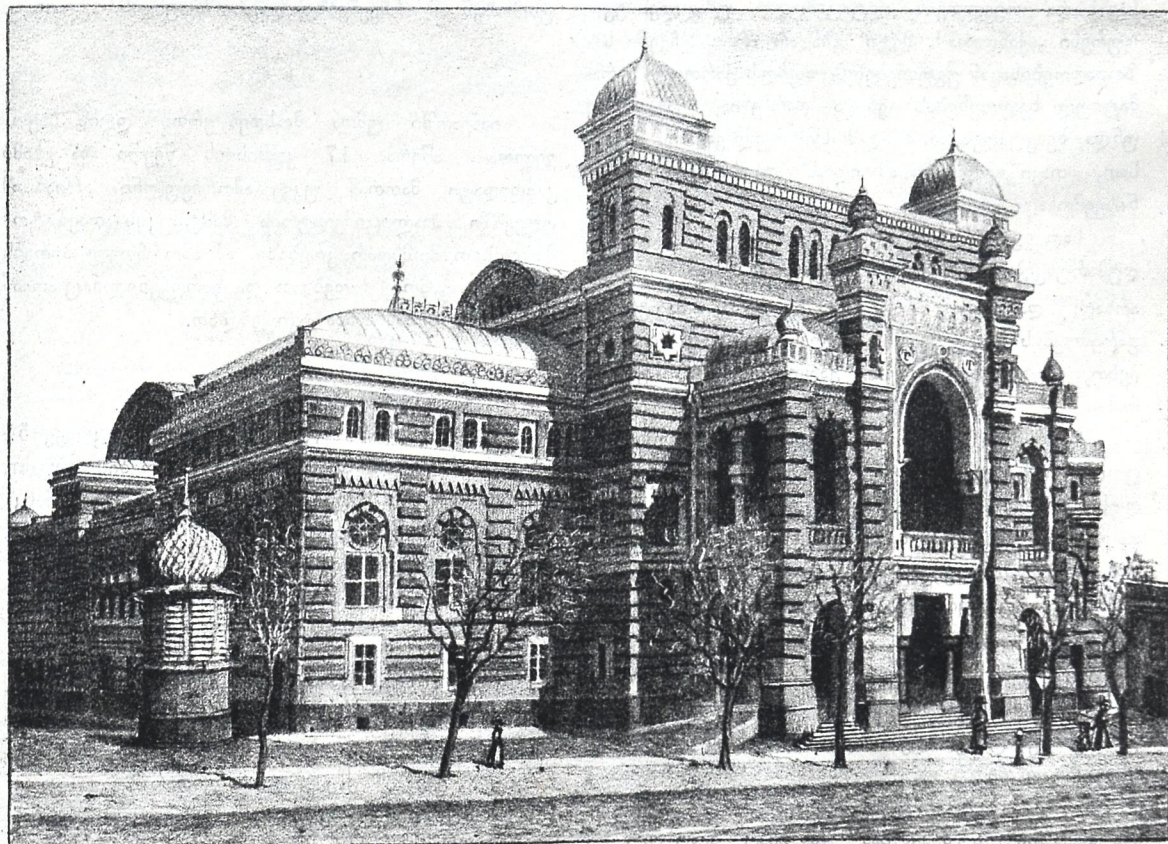
თბილისის სინაგოგის თეატრი.

საკოლიტიკო, სამეცნიერო და სალიბერატურო ნახაზობიანი ვაჭათი ვაგოდის უოველ კვირა დღეს № 47 ნოემბერი 10 1896 წ. № 47