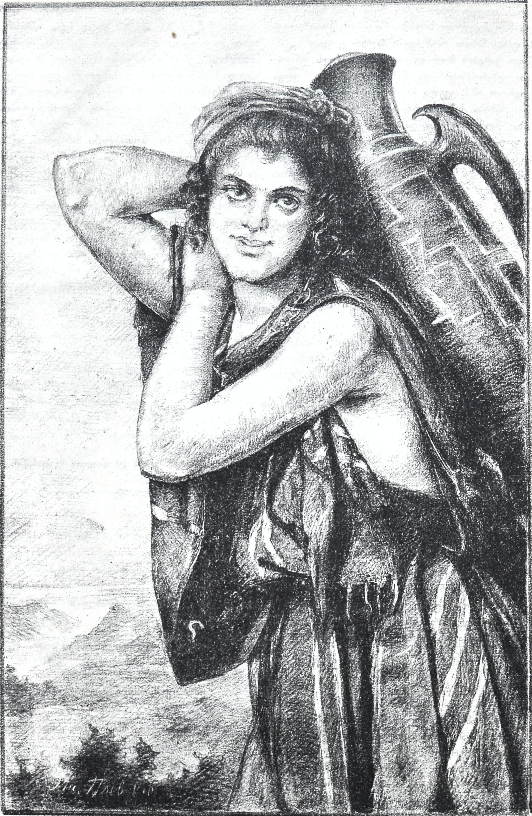
წყალზე მიმავალი კახიანელი ახალგაზდა ქალი (აღყირში).