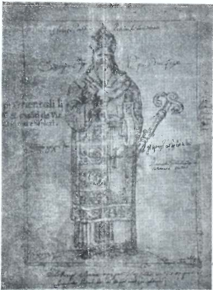
შალაქია კათალიკოსი, გამხენილი მღვდელ მთავარი XVII სსუკ. საქართველოს ისტორიაში.