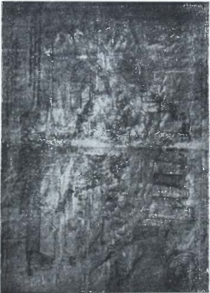
ქალაქი გორი და მისი ციხე დას. 1633 წ. მ. თამარაშვილის კალამით.