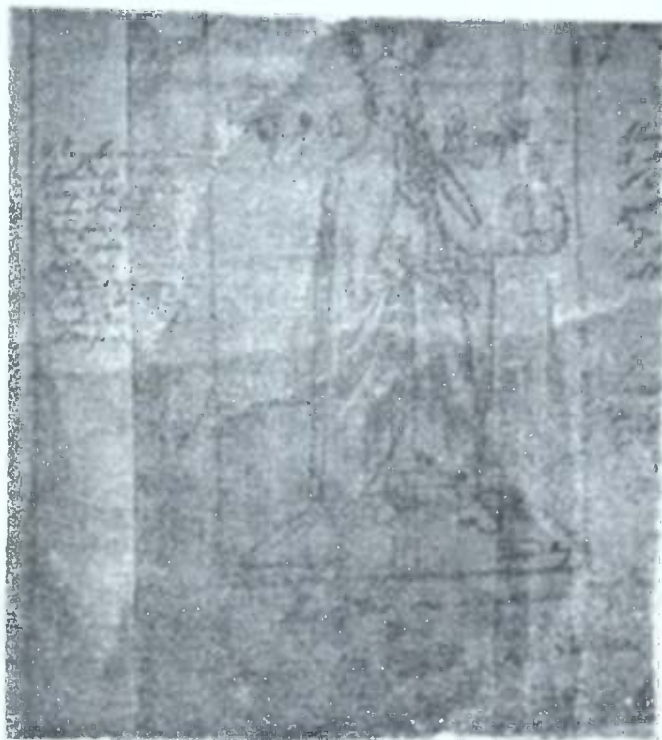
ლეონ დადიანი სმთავრის სმისით XVII სუკ. დასტ. 1633 წ. მ. თამარაშვილის კოლექციიდაშ.