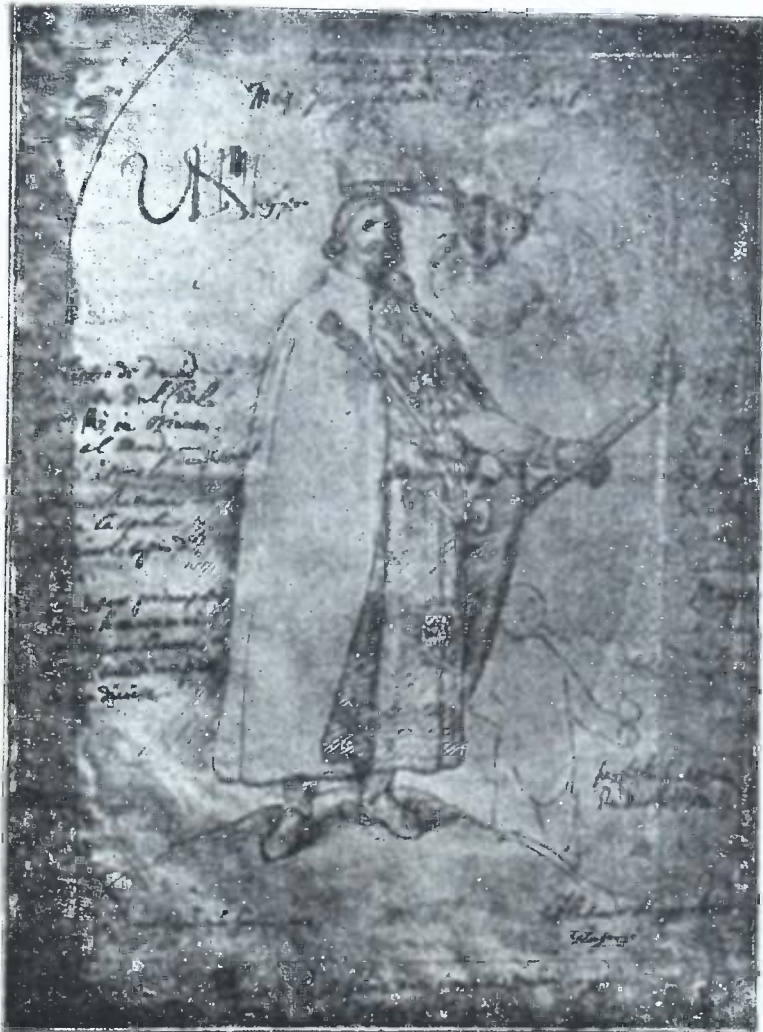
ალექსანდრე მუევი იმერეთისა 1639—1660