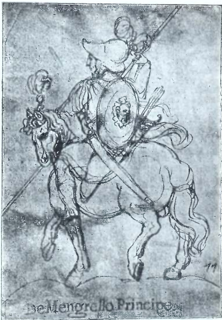
ლეონ დადიანი 1611—1637 ნატრი შის. თამარაშვილის კოლექტიდამ.