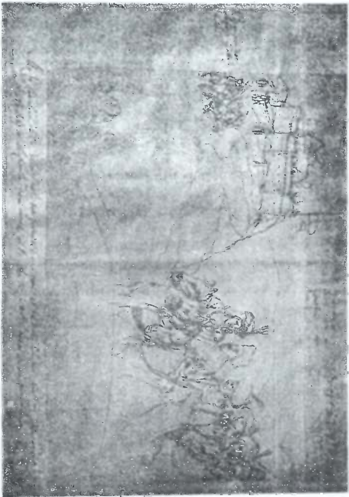
იმეტეთის მუფის ჯღუკსანდრეს მტკვარის თათარულთა კრდების მისიონერებთან, ნახატი 1633 წ. შ. თამარაშვილის კალენდრით.