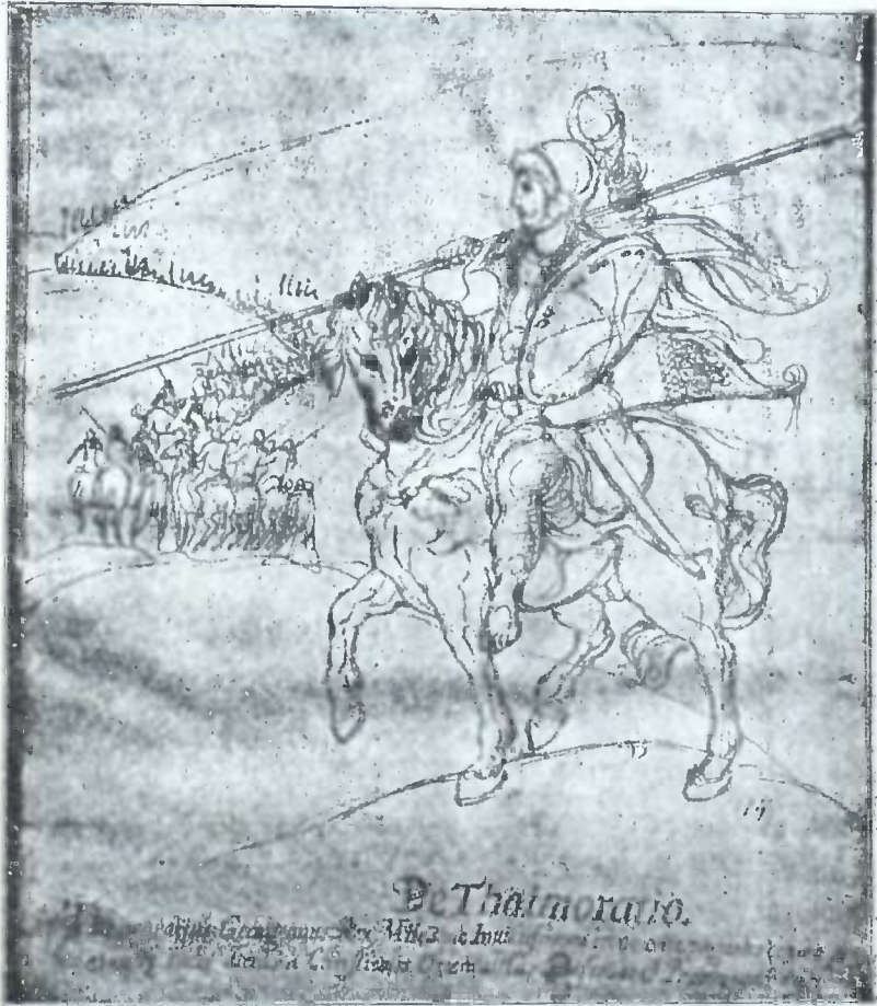
თე-მურაზ I მეფე კახეთისა 1605—1663 ნატრა მის. თამარაშვილის კოლექტივად.