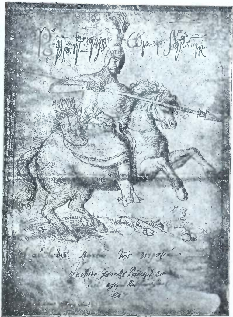
ვახტანგ გურიელი 1639 წ. ხატრი მის. თამარიშვილის კოლექციიდან.