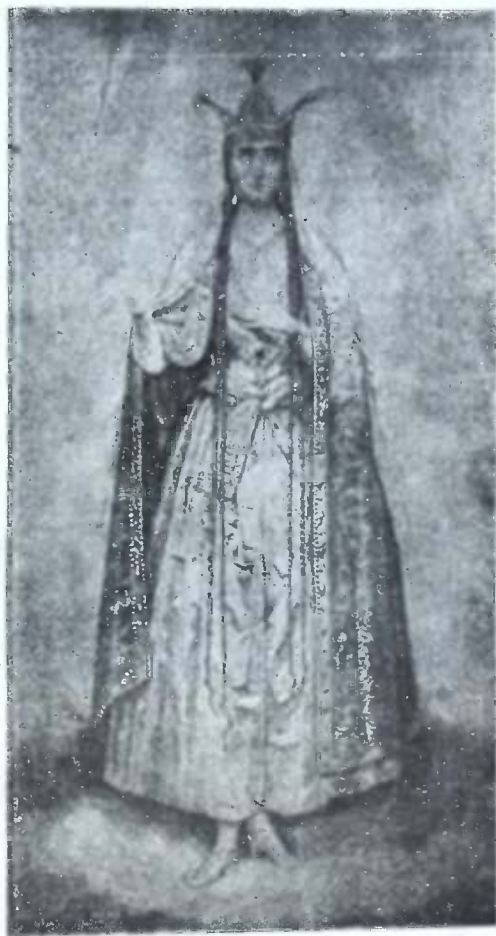
ქოქავან დედამთავარი წამებულის სჯულისთავის