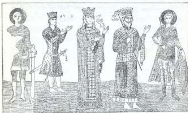
გიორგი ლაშა, თამარ მეფე, დავით სოსლანი.

ლაში დადგეს კარავი და მორთეს დიდებულად. შიგ დადგეს ოქროს ტახტი თამარისთვის. ტფილისითგან რომ გაემართენ აგარაში თამარი, დავით და მათი შვილი გიორგი ლაშა, გზაში მათ რიგ-რიგად ეგებებოდნენ სხვა-და-სხვა თემის ჯარები. პირველად მიეგებენ ყივჩაყები და ოსები, შემდეგ ერელები და კახელები, იმათ შემდეგ ქართლები, შემდეგ მეს-