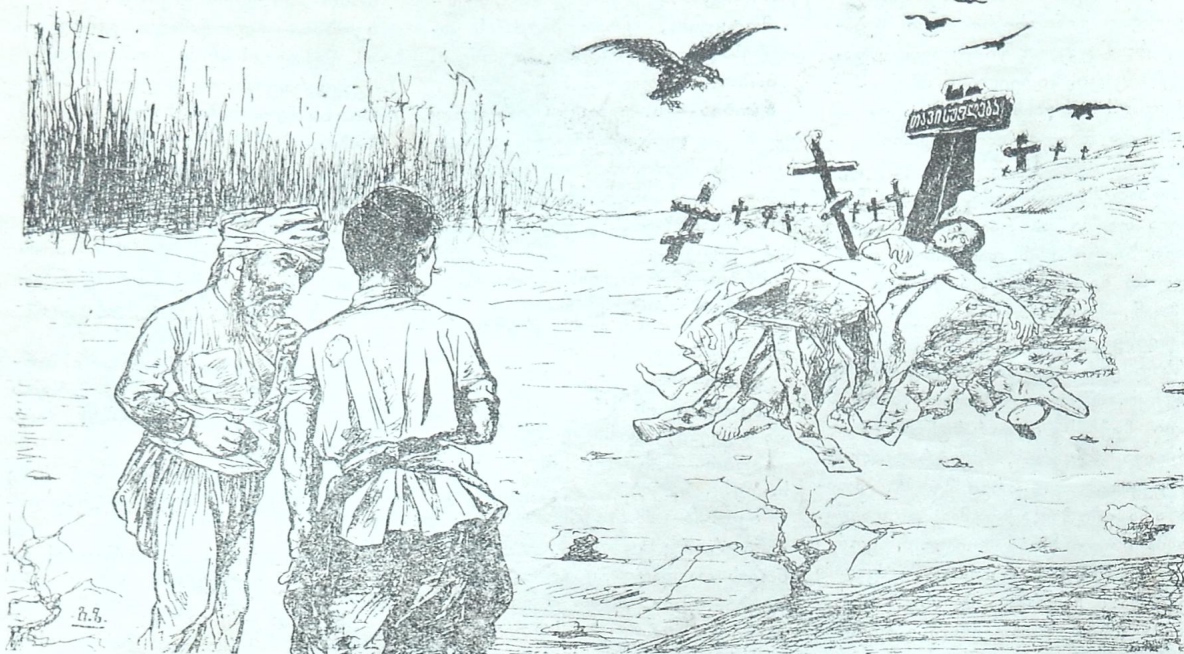
რედაქტორ-გამომცემელი აკაკი წერეთელი.