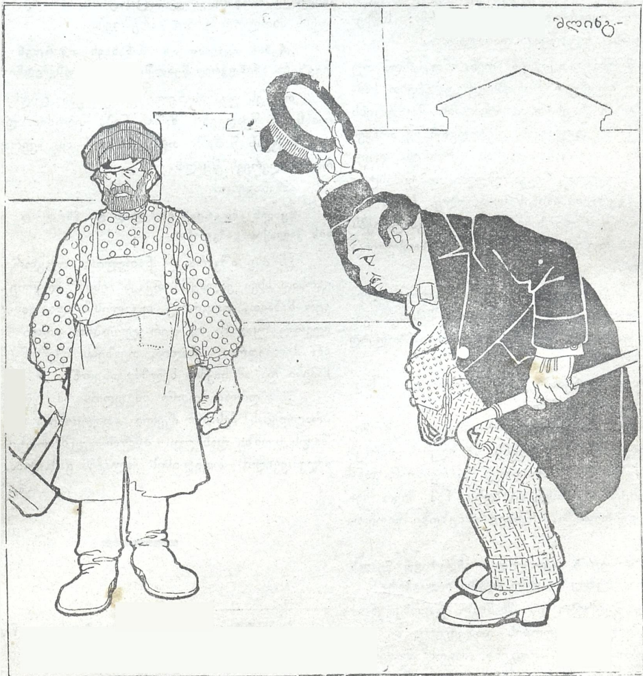
ახლა კი რას ვხედავთ?..

განა დიდი ხანია მას შემდეგ, როცა საბრალო მუშა რკალივით იგრიებოდა თვისი „საცვარელი“ და „კეთილისმყოფელი“ აღის წინაშე, რათა მისი დახმარებით ნახევრათ მშვიერი არსებობა თვისი უზრუნველყო?..