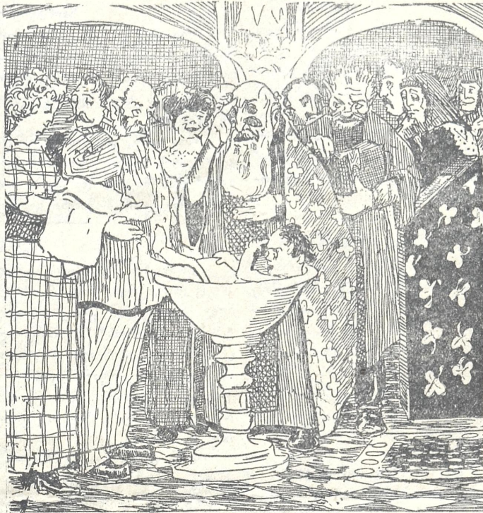
წმინდა ნათლისღება სოლომონ ზურგიელიძისა.