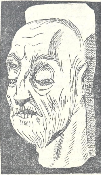
ნილაბი სოლომონისა გადაღებული ი. ნიკოლაძის მიერ.