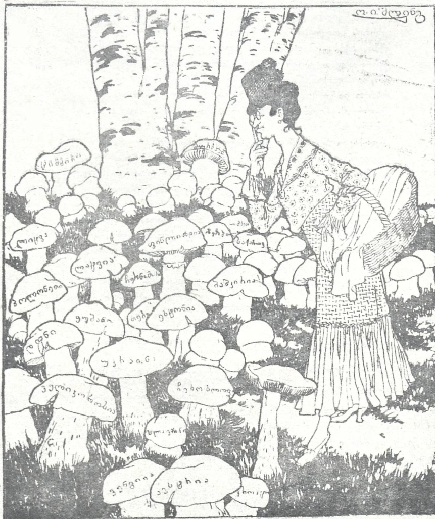
ქ-ნი ჯანაძე. საკვირველია ამ ნანგრევებზე რამდენი სოკო აღმოცენდა. ენახოთ ჩემთვის რომელი ივარგებს.