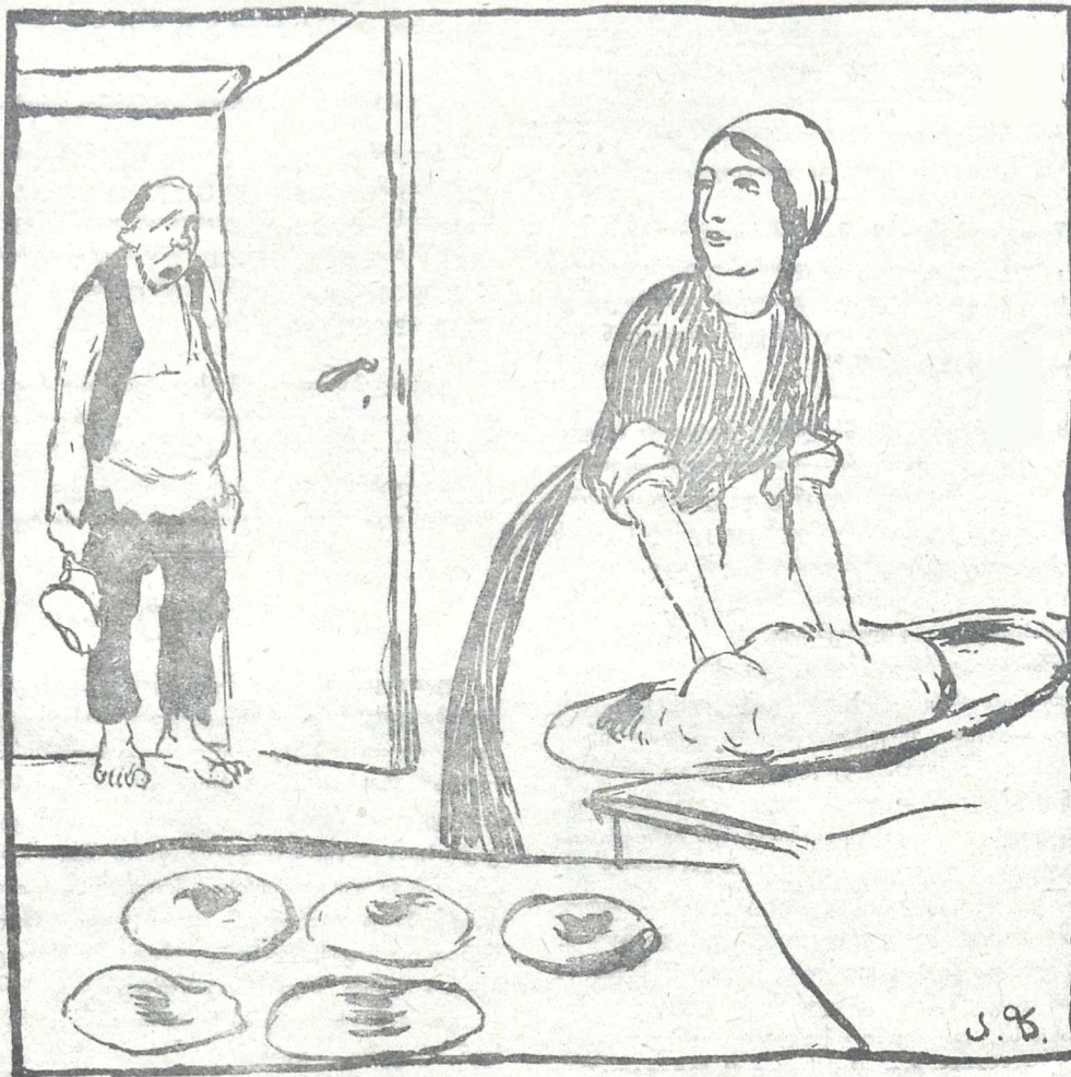
დენიკინი. მშვენიერო მეზობელო, მოხუცი კაცი ვარ ნუ გამიმტყუნებ, თუ ამდენს ხანს ვერ გიცანი. ჩახლა კი გცნობ, შენ სწორედ საქართველო ხარ... საქართველო. თქვენ თითონ ვინა ბრძანდებით. სრულად გერა გცნობთ...

ნახუტურელს. „მუშაკის მათრახს“ ფოთიდან ბუტუნა აწუდის ცნობებს: თქვენი კარიკატურის გეგმა გვარია, მხოლოდ არ ვიცით რა საგანზე გასურთ რომ დახატოს.