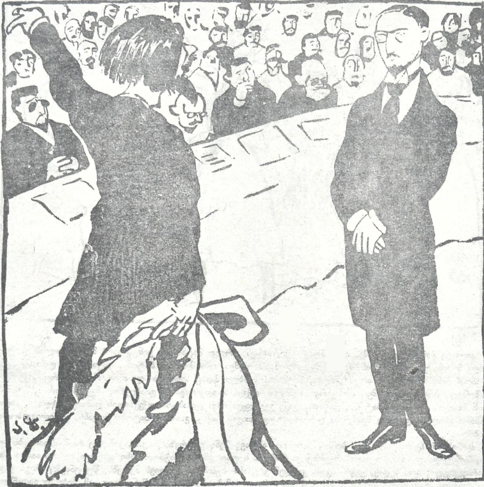
საიუბილეო შილოცების დასაწყისი.