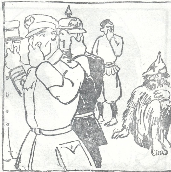
მაგრამ მას, ე. ი. კომუნისტს, უფრო ადვილად და შეუცდომლად სუნით სცნობენ ხოლმე.

მაგრამ საქმე, ძმავ, ის არი, ცოლები რომ აცოლებენ (შაშს და ფიქრებს იცილებენ) მამებს შვილნი მისტრიან — გულრწფელ ტრემლსა დააღვრიან.. ცოლები?... რა მოგახსენოთ?! ვფიქრობ გაზეთი გამოვსცე „მოამბე“ იქნეს კოჯორის, საშვალეება ყველას მივსცე — ცნობა ამბის მხარის შორის, (სულ სიმაართლის, და არ ჭორის) მაგრამ... რა ვსთქვი: აქ კოჯორში ყველაფერი ასად ძვირობს, — ტფილისელი გაზეთები ორ თუნად ღირს — არცინ კვირობს, აბა თქვენ საქვით, რომ გავყადო მე „მოამბე“ მაქ კოჯორელი, ფასი უნდა გავადიდო ამბებით ვქნა ის მე ჭრელი — თქვენვე ბრძანეთ — იმდენს მომცემთ რაც „მოამბე“ დამაჯდება. არა, ჭკვაში არ მიჯდება. რომ ზარალი მე აქ ვნახო