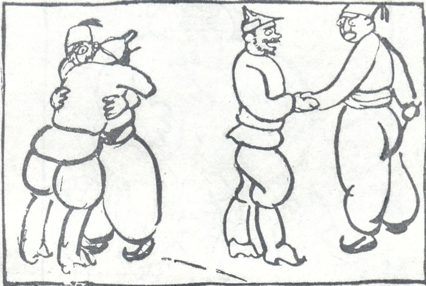
კომუნისტი (ოსმალის) მოდი, მოდი გადამეხვიე ყარღაშ, ჩვენ ერთად უნდა ვიხსნათ აღმოსავლეთი და დასავლეთი ბარბაროსებისაგანს.