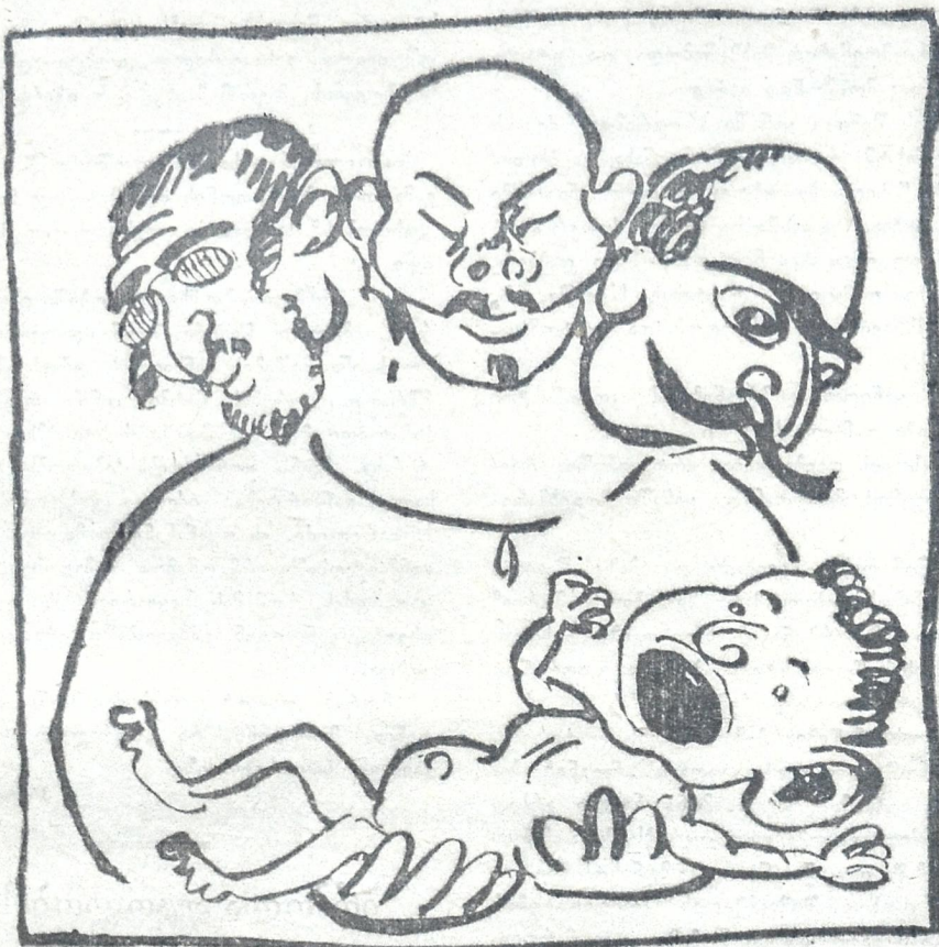
სამპროვანი მამის პირმო რუსული კომუნისში.