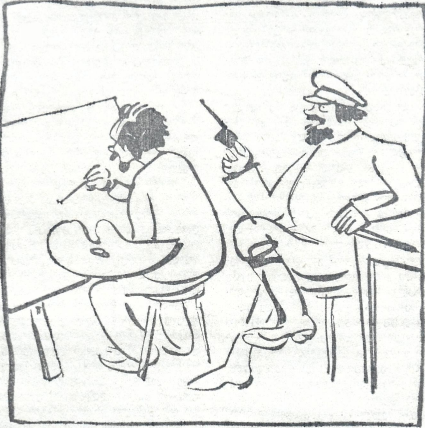
საბჭოთა რუსეთში მხატვრობას ფართო ასპარეზი აქვს მიცემული: პლაკატის დამთავრებამდე მხატვრის სიცოცხლე უზრუნველყოფილია.

მორება. რაღა ვქნა ახლა... ნენა, ნენა, ნენა. (მიძახის გზაში ხმა მალლა გიტო და ექიმის მოსაყვანად მირბის).