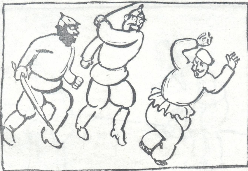
კომუნისტა (ადირბეიჯანს) შე თათარო მამა... მე, ვეცი, როგორი უნდა ასწავლო თათარს ქულა. აი როგორ, აი როგორ!

გორი ტანისამოსიც უნდოდა ისეთი ეტარებია და წვერიც ისე შეეხეინტილებია, რა ფასონიც მის სახეს მიუდგებოდა.