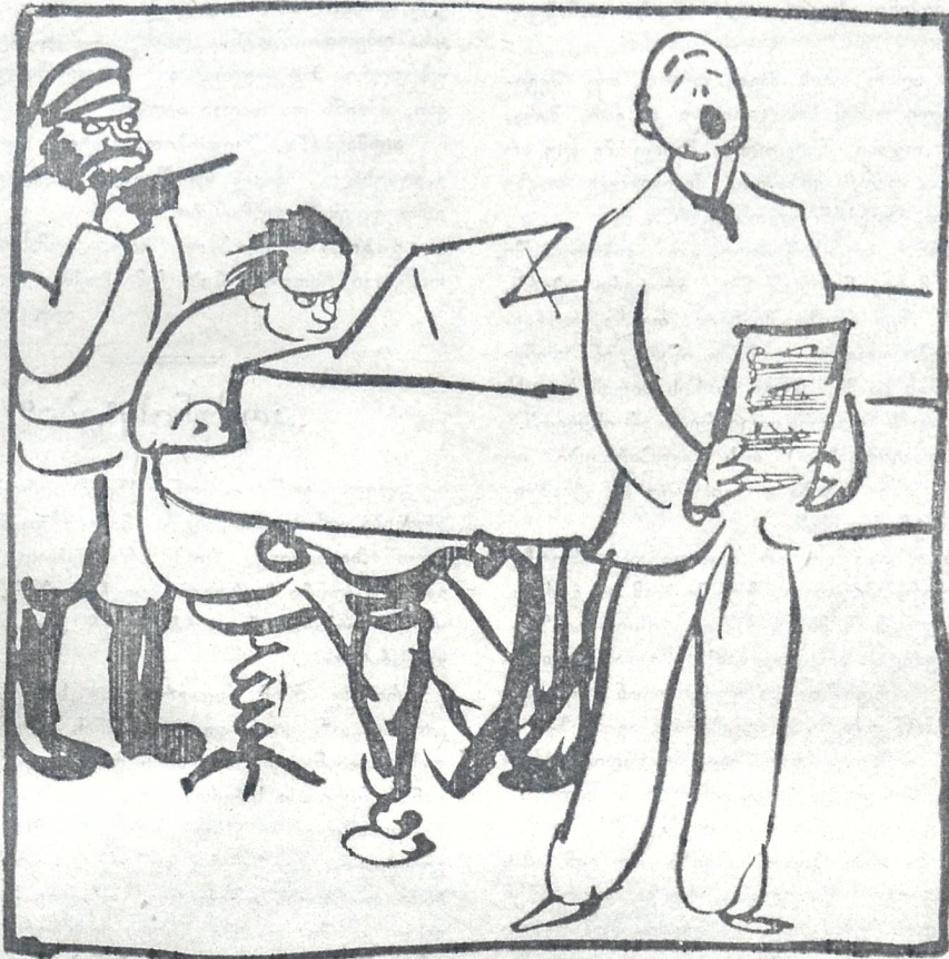
კომუნისტურ რუსეთში ხელოვნება წარუღიად თავისუფალი ყოველგვარ ძალდატანებისაგან, რაც აშკარად სჩანს ამ სურათზე.

ალმასხანა. მართლა საცოდავი ყოფილხარ ბიჭო გეტოია, რაღა დროზე უ გშლია ოჯახი?!