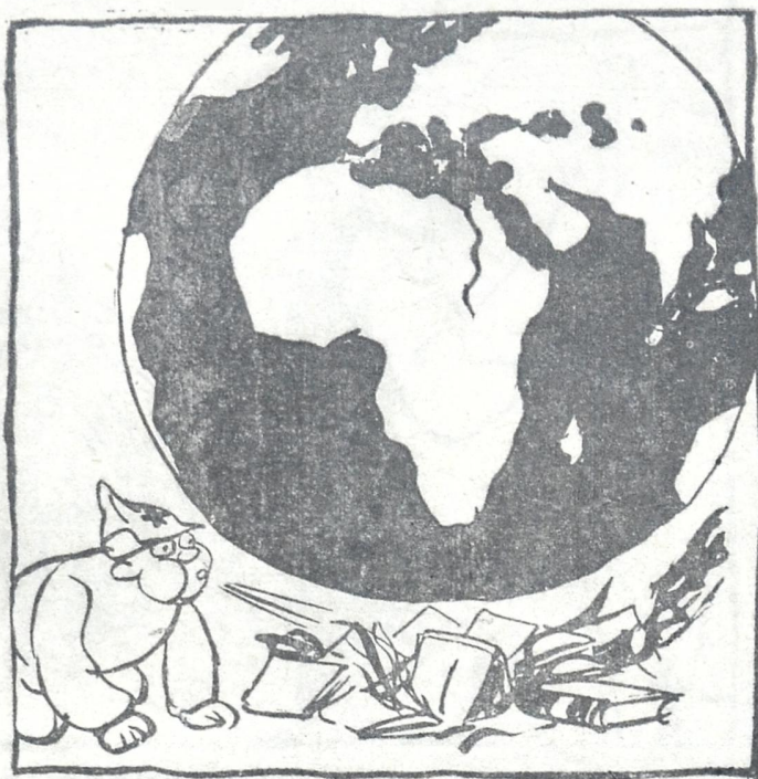
კომუნისტმა განიზარაბა მთელი ქვეყნიერობის ცეცხლში გახვევა და თავისი ბროშურები შეუნთო.

ვცდილობ არაფერი დავაკლო ჩემს თავს და საუკეთესოთ ვიცხოვრო.