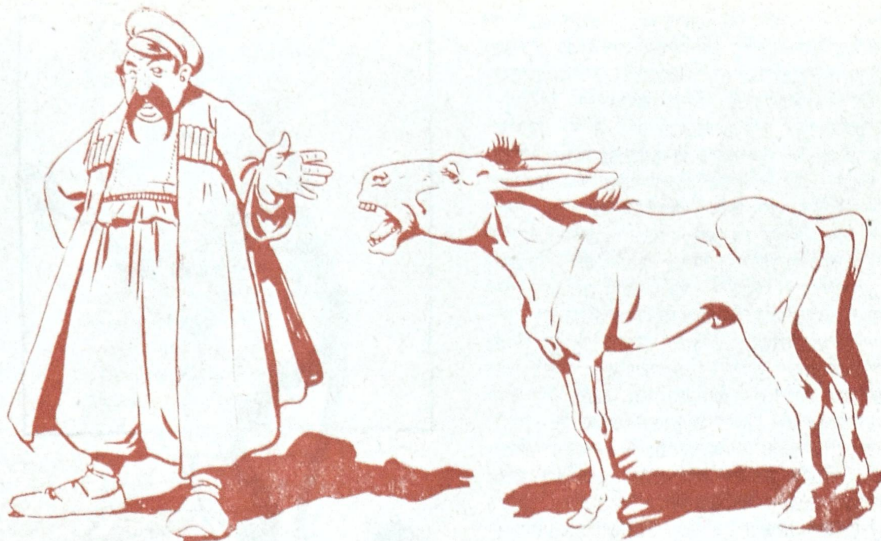
3060. —ვა! ამაზნავო! რა გაღრიავლებს? რა მოხდა?