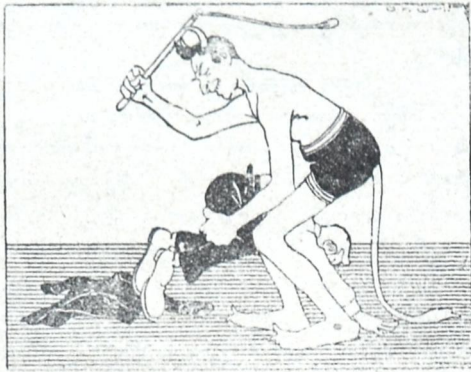
სახელი სხვისი სასჯელი მისი.

ჩაფიქრებულია მამუკა ორბელიანთა გვარისა, თავ დაბჯენილსა მკლავზედა, ზღვა დასდის ცრემლთა ღვარისა.