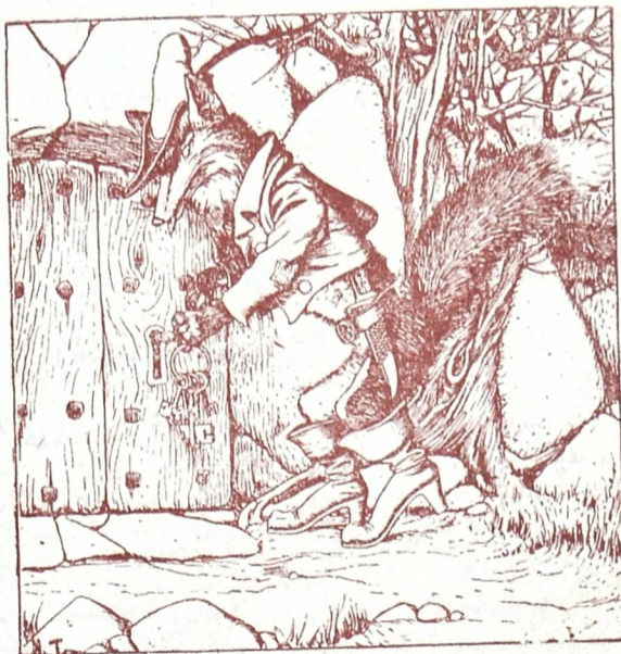
ერთი „საორშაბათო“ გაზეთის რედაქტორი დალღს ამოწმებს.

ბიან, თავის მსხვერპლს იტყვს, ვერ ქაჭკვებით ჭკლავს ხოლო შემდეგ საწუწნი მალებით სისხლის სწოვს.