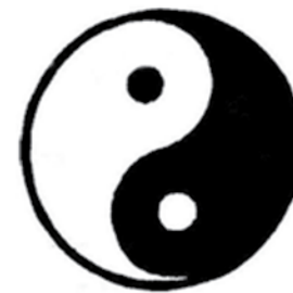
06 – 016

აღმოსავლეთის კოსმიური მხედარი მითოლოგიაში არის ორივეს – კეთილის და ბოროტის გამოვლინება, ანუ ორივე საწყისი ერთშია .