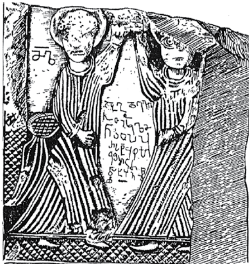
დავათის სტელა (ძ.ვ.წ. 680 წ.)

ზემოთქმული ცნობიერებაა ასახული საქართველოში მოძიებულ დავათის სტელაზეც, რომელიც აღმოჩენილია დუშეთის რაიონის სოფ. დავათის ზეთისმშობლის ეკლესიაში, რომელსაც