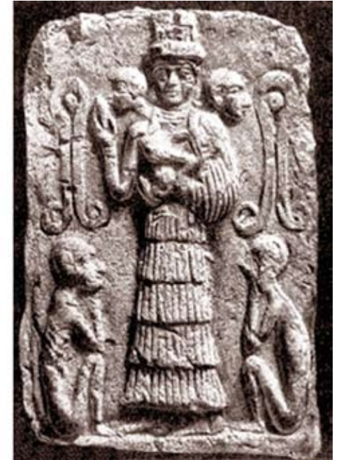
შუმერი (ძვ. წ. III ათ.)

რითაც უძველესი ცივილიზაციის ხალხი გამოსახავდა სამყაროს დედას – სამოთხეს, რომლის ფეხებთან ორი კუდიანი ადამიანის ფიგურაა. თაყვანს სცემენ ცენტრალურ ფიგურას, ხოლო მხრებზე ადგას ადამიანის სახიანი ორი ანგელოზი, რაც მთლიანობაში შვიდი „არსების“ ერთობაა. სწორედ ეს არის სამოთხე – უარყოფითი და დადებითი არსებების ჰარმონიული თანაარსებობა – ასეა აღწერილი სამოთხე შუმერის მითოლოგიაშიც. ირგვლივ შემოვლებული გარე კონტური მიგვანიშნებს იმაზე, რომ ეს ყველაფერი