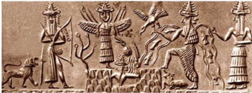
შუშარი (ძვ. წ. 3400 წ.)

ქართველთა ხვთისშვილები, რომლებიც არიან ნახევარღმერთები, ნახევარშხეები, ბერები, ბედის ბედაურის მფლობელები, მუდმივად არიან დევებთან და ქაჯებთან მებრძოლეები და ყოველთვის იმარჯვებენ მათზე. ხვთისშვილმა კოპალამ ქაჯებთან ბრძოლაში ლომი მოიპოვა, რომელიც ქაჯთა ძალი ეგონა, ბუქნა ბაადურმა – ხარი, თერგვაულმა – თეთრი მთის ქორი, ხოლო ქართველთა მითებით ბოლო 64-ე ხვთისშვილმა იახსარმა თავისი დობილი – სამძივარი მოიპოვა. აქაც, ხვთისშვილი იახსარი, რომელიც არის მამაღმერთის ერთ-ერთი სახე, ქაჯებისგან ათავისუფლებს თავის დობილს – ქალს და ამ ორი ნახევარშხის შეერთება ქმნის გამთლიანებულ შხეს, ანუ ოქროს საწმისის – ცეცხლის სტიქიის ენერგიას. ქართულ მითოლოგიაში შხე ქალია – ქალღმერთია. ეს კოსმიური პროცესი გენეტიკურ დონეზე აისახება ყოველ მიკრო და მაკრო სამყაროზე.