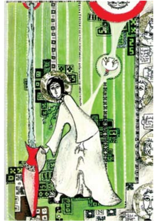
მხატვარი: ლ. ვარდუშიანი

ერთ დილას, ნახევრად მძინარეს, მქონდა ხილვა: თითქოს ვიწექი იმ ოთახში და იმ საწოლში, რომელშიც სინამდვილეში ვიწექი. ოთახს ჭერის ნაცვლად ცა ჰქონდა. დავინახე ცის სიღრმიდან ჩემკენ დიდი სისწრაფით მოფრინავდა რაღაც გამოსახულება, რომელიც თავდაპირველად წერტილის სახით მოჩანდა, შემდეგ თანდათან გადიდდა და დავინახე, მიახლოვებოდა ტახტზე მჯდომი მამაკაცის ხატი, შავი წვერით და სამეფო სამოსით; ტახტი, რომელზედაც ის იჯდა, ჰგავდა სვეტიცხოვლის და სამების ტაძრების საპატრიარქო ტახტს. ისე ახლოს მოვიდა ეს გამოსახულება, რომ ხატის ჩარჩოს საზღვრები თანდათან ოთახის კედლებს გასცდა, მე აღმოვჩნდი ხატის შიგნით, ხოლო ტახტზე მჯდომი – ჩემს სასთუმალთან და უკვე ცოცხალი ადამიანის სახით მიყურებდა. ბოლოს უსიტყვოდ – აზრებით მეკითხება: „როგორ იყენებ, რაც მოგანიჭეთ“?! მე ვპასუხობ, რომ „ადამიანებს ვმკურნალობ, ფულს არ ვიღებ მომსახურებაში.