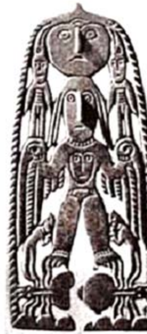
კომი (VII-VIII ს.ს.)

ადამიანის თავის სახე აქვს. მათი მრგვალი თვალები მიგვანიშნებს, რომ ისინი მღვდრ არსებას წარმოადგენენ. მაიას ტომებთანაც ქვის გამოსახულებებზე ადამიანის გულს ადამიანის სახე აქვს. რჩება შთაბეჭდილება, რომ ერთმანეთში ჩასმული ეს სამი ფიგურა – ერთარსება განასახიერებს სამყაროს ზესკენელ-ქვესკენელ-შუასკენელს,