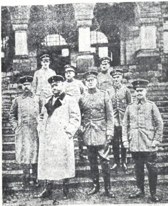
დენერალი გინდენბურგი და მისი შტაბი პოლონეთში

დასასრულ, ვუსურვებთ სიცოცხლეს ახალს თანამომეს და სიამოვნებით ხელს უწვდით საერთო მოქმედებისათვის.