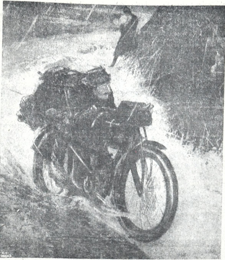
ფრანგის მოტაციკლისტმა გაასწრო ჩასაფრებულ გერმანელებს და ამბავი მიაქვს უმფროსთან.