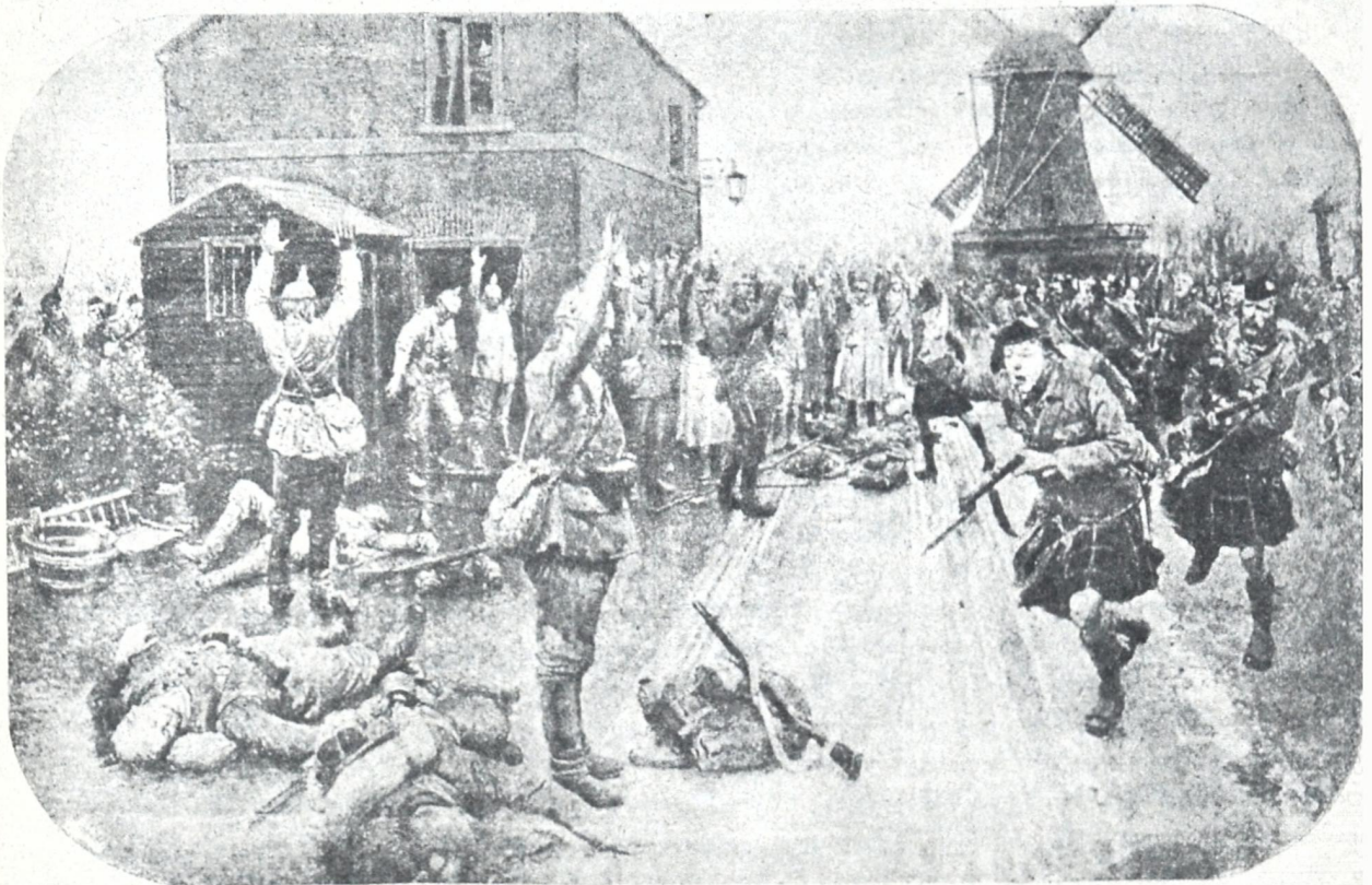
შოტლანდიელები ატყვევებენ გერმანელ რაზმსა.

მისამართი: თბილისი, გაბაევსკიი პერ. № 3 რედაქცია „კლდე“. დეპუტისა: თბილისი კლდე.