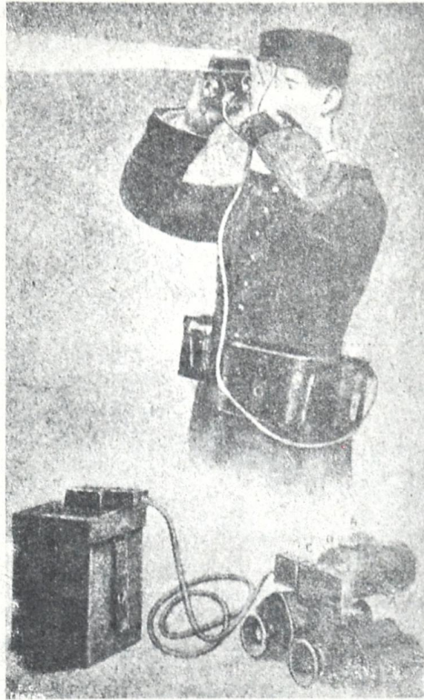
ელექტრონის ლამპარი—დურბანდი, რომლის საშუალებით გერმანელები ნიშნებს აძლევენ თავიანთ ჯარსა.

მსხვერპლით, ქვეყნის აოხრებით, განადგურებით. სამხრეთითაც, სერბიის გამარჯვების ავსტრია-ზედ და ოსმალეთის დამარცხების შემდეგ სარიყამიშთან—ომი თითქო შესუსტდა და მინელდა. ასე რომ ყველგან შედარებითი სიწყნარე ჩამოვარდა. შორეულ აღმოსავლეთში ხომ ცინდაოს აღებით სულ შესწყდა ომი. ზღვაზედაც შედარებითი სიმშვიდეა და ამგვარად 1915 წელიწადს თითქო საერთო სიმშვიდით ვეგებებით; მაგრამ ვაი ამ სიმშვიდეს. ეს უბრალო შესვენებაა, ჰაერის ამოღება ომის ღმერთისაგან და ახლო მომავალში უნდა ველოდეთ უფრო სასტიკს, უფრო მწვავე ამბებს ვიდრე აქამდის იყო.