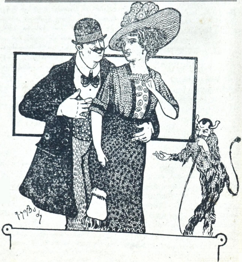
— ვინ დაჟერებს, რომ ეს ორნი, ხუთი წუთის წინ ერთმანეთს სრულიად არ იცნობდენ!

ვისაც ყლით სურს, თითო წიგნს მიემატება ფასი თითო მანეთი. მსურველებს პროვინციებშიაც გაეგზავნებათ ჩვენის ხარჯით. ფული და წერილები გამოგზავნება ამ ადრესზე: Тифлисы, Типография Шрома, Теофили Болквადзе.