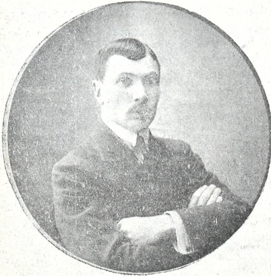
ი. გ რ ი შ ა შ ვ ი ლ ი