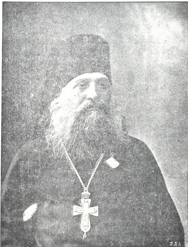
ნაზარი ქუთათელი (დასახიროს)

ქუთაისის მიტროპოლიტად არჩეული გიორგობისთვის 17