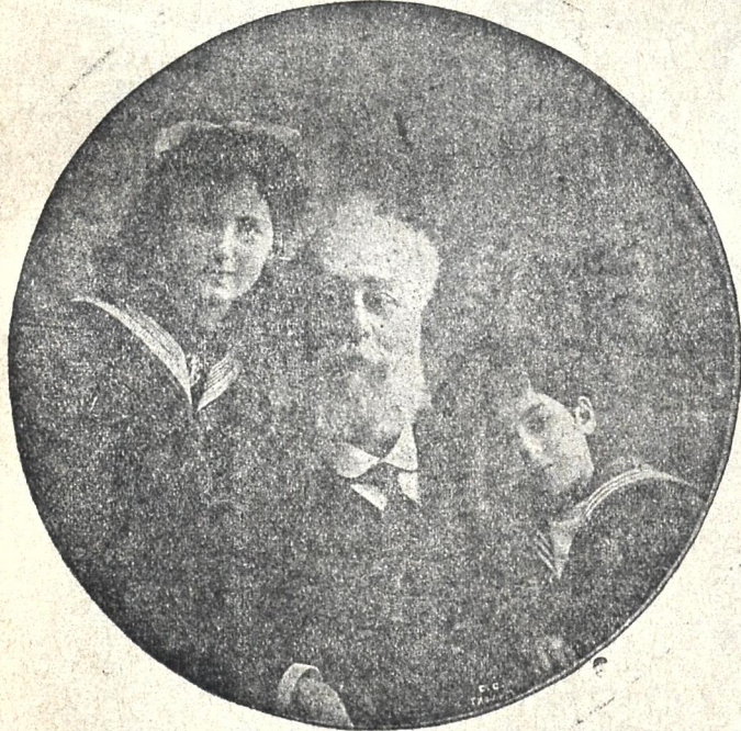
აკაკი — ბავშვთა მოეუარული გარდაცვალების ორი წლის თავი იანვრის 25

№ 4 — 1917 წელ. მესამე ფასი კვირა იანვარი 22 გამოცემისა 15 კ.