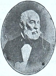
დმიტრი ივანეს ძე ყიფიანი 1814—1887—1914