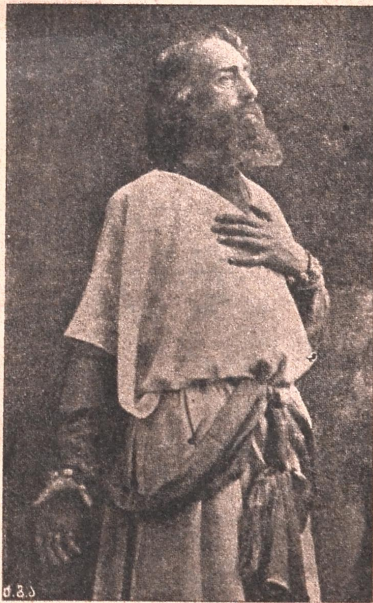
მისი იმპ. უმაღ. დ. მ. კონსტანტინე კონსტანტინეს ძე (კ. რ.)

(იხილე ამავე ნომერში „ქართველ მწერალთა წერილები“)