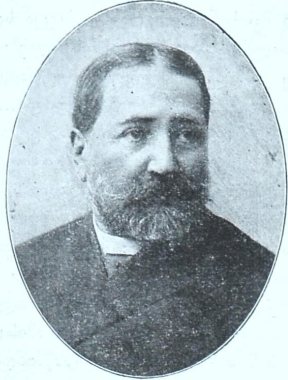
ილია ჭავჭავაძე (1837—1907)

მესამეტე წლების მოღვაწეობას შექჷმნეს სხა-ლი ხსნა საქართველოს ცხოვრებაში, ამათ გამოცხსა-დეს დაურადებლად ეროვნული პროგრამის, მამეობა იტ-