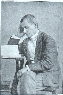
დამსახურებული მსახიობი ვას. ალ. აბაშიძე