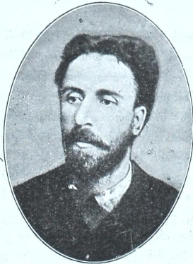
მწერალი ე. ვ. ნინოშვილი (გარდაცვალებიდან 20 წ. შესრულების გამო)