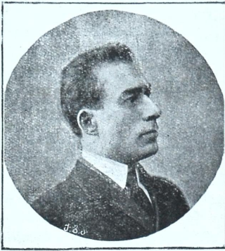
მსახიობი ვიქტორ მატარაძე (ავადმყოფობის გამო)