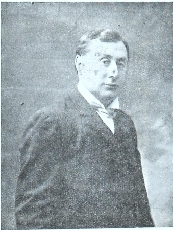
საფრანგეთის თეატრის „ოლეონი“-ს გამომჩენილი რეჟისორი ანტუანი