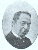
† კ. მესხი (1859—1914)