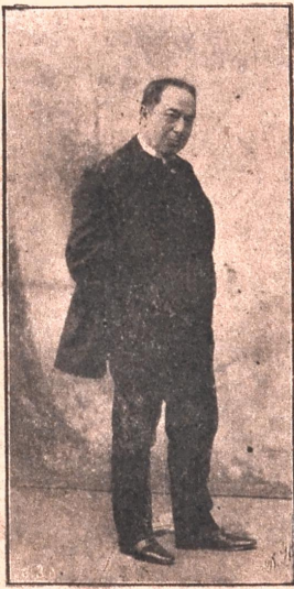
† კოტე მესხი

ვინც სამშობლოს საკურთხეველს გრძობის ცრემლებს აწვევდა, აღმაფერხით შესივობდა, სიუფარულათ მისხურებდა, ვინც ზეზეტურ სიცილითა ხალხის გულს ნათელს ჭებენდა საიდუმლო სულის შებით, სამოთხეში აღაფრენდა,—