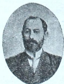
ნო უორდანია ჯგაღმუფოფობის გამთ