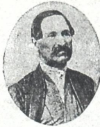
ალ. ვახ. ჯ. ორბელიანი

მწერალი და გამორჩენილი მამულიშვილი, დამწერი პიესა „დავით აღმაშენებლის“, „მეფე ერეკლე პირველის დროისა“, „აღამამაზნდნანის შემოსევის“ და სხ., რომელმაც გასული საუკუნის დასაწყისში თანამემამულეთ მამულიშვილთა რიგში გრძობა ჩაუნერგა და სამშობლოს სიყვარულის კენ მთო-წოდებდა, წვერი ფარული სახ-ისა.