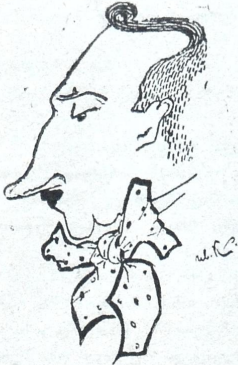
ბ. ხ. ჩერენინი (შარტი)

კონსერვატორიის დირექტორი და სახელმწიფო თეატრის ლობტარი.