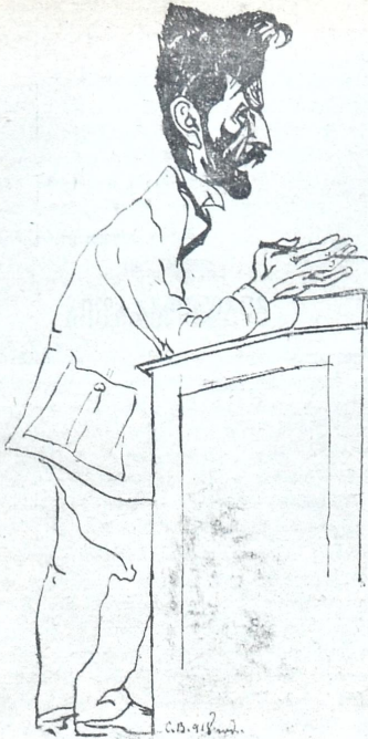
რევაზ (რევა) გაბაშვილი.