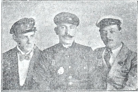
არკინის გზელთა ცენტრალურ გამგეობის სარედაქციო კოლეგია