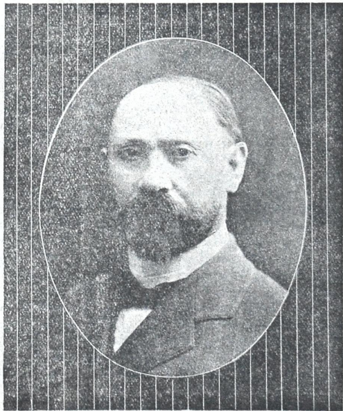
შიო მღვიმელი — ბავშვთა საყვარელი „შია შიო“ (უკანასკნელი სურათი)