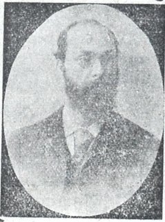
კრიტიკოსი ხომლედი რომანოზ სპირ, ძე ფანცხავა (იხ. წერ. ამბე! № 7 გვ.)