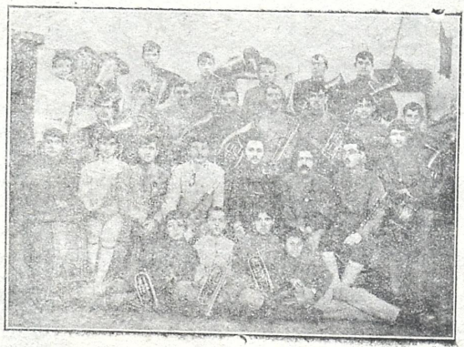
ხაშურის სახ. გვარდიის მუსიკა

( მ ა თ ი კ ო ნ ც ე რ ტ ე ბ ი ს გ ა მ ო )