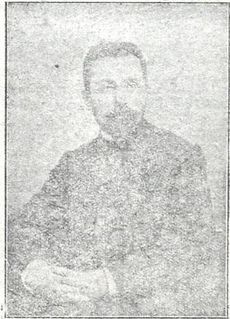
აკადემიკოსი ნ. მარიაშვილი