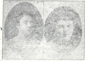
მ ა რ ი დ ა თ ა მ რ ი

აი, ჩვენი განახლებული სამუსიკო ხელოვნების ორი ნორჩი, ჯერ გაუფერჩქნელი ყვაილი.