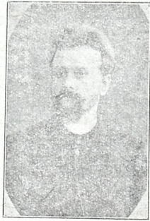
კომპ. მ. ბალანიშვიძე (მოკლე ხანში მისი ოპერის დადგმა განზრახული)