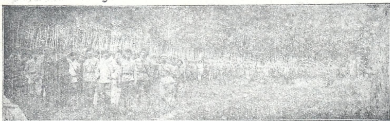
სამეგრელოს მეორე ბათლიონი ცხინვალის ფრონტზე.