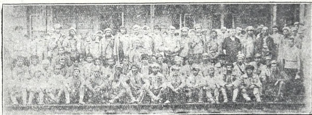
ადერბეიჯანის ტყვეობიდან ჩამოსული ქართველი ტყვენი თბილისის სადგურზე, ჩამოსვლისთანავე გადაღებულნი.

მამაკურ ბრძოლაში უამრბ მტრისგან დატყვევებულნი, რომელთაც ადერბეიჯანში კომუნისტ-ბოლშევიკებმა საუკე-ესო ტანისამოსი გააძვრეს, თავისი ძველი ტანისამოსი ჩააცვეს, ქუჩა-ქუჩა ატარებდენ და ხალხს ეღბნეოდენ: აი საქართველოს ასეთი ჩამობღღერბილი ჯარბი ჰყავსო. შემდეგ მოსთხოვეს — ჩვენს „ქართულ“ პოლკმა შემობდათ საქართველოს წინააღმდეგო, მაგრამ რაკი ტყვენი არ დასთანხმდნენ, ნაგრუნის კუნძულზე გადასახლეს და თითქმის შობილით დახოვეს. ზავის შემდეგ ეს ტყვეები გაანთავისუფლეს.