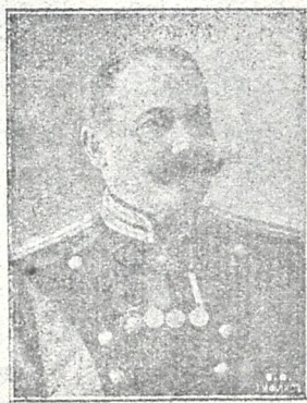
თავ. კ. ნ. აფხაზი ამერ იმერეთის თავდაზნაურთა წინამძღონი, რომელთაც საზოგადო ქონება ეროვნულ ყრილობას გადასცეს