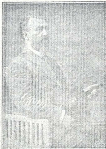
კომპოზ. ანდრია შარაშვილი

ოპერა „ვეფხისტყაოსანი“-ის ავტორი, მისი ნაწარმოებების შესრულებულ იქნებოდა მომღერალ-მუსიკოსთა კავშირის მიერ გამართულ საღამოზე 17 ქრისტ. ქართულ კლუბში.