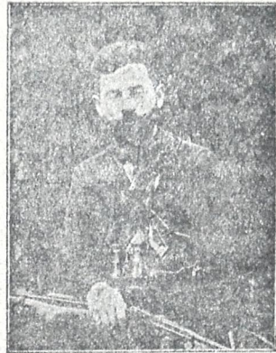
მალოდინა სბზას ძი ზომზამძი თბილისის მუშათა წითელი გვარდიის ხელმძღვანელი, ძველი რეჟიმის დროს ცამეტი წლის პოლიტიკური დევნილი.

წასვლის უგანასხეულ წამებში აღმოჩნდა, რომ პირველი არტისტი ქალი ვადმოყოფობის გამო ვე- ლარ გაპყეებოდა ამხანაგებს, სხვა უნდა მოწყვითათ ამის მაგიერად და ის სხვა კი, სრულიად გამოცდილ არ იყო არხეულ რელებში, მომზადება და გაწრთვან კი უველას აზრით, მარტო გრეგორს შესძლო. მგოსანმა იეტესმა, რომელიც ერთი პირველთაგანი იყო ირლანდიას თეატრის დოფუ- ძნებისა, მისწრა: თქვენი წაუსვლელობა არ შეიძლ- ება. ლუდი გრიგორი მოემზდა ს:ჩქაროდ და წაქვეა დასს. იმ დროს ირლანდიაში რკინის გზის გაფიცვა იყო და ის ავტომობილით გემგზავრა პორტლანდ. ის მწუხარებით უამობდა უველას, რა ომის წასვლა თითქმის შეუძლებელი იყო, რადგანაც მხლოდ გუშინ გაუჩნდა შვილისშვილი და შვილს პატრონობა უნდოდა, მაგრამ რაკი მისს მეტი მო- უმზადებულ იყო და შეიძლებოდა თავის რელი წკუნდინა იმითომ თავი დაანება ასეღ მელოცინეს და თავის დიდ რჯახს, რომელსაც მართავდა და განაგებდა, და რამდენიმე თვე დარჩა ამერიკაში, სადაც კითხულობდა წერილებს, სწრთვინდა და ამზადებდა არტისტებს და კრიტიკა ედგა მლოცინას, რომელიც წამდაუწყუმ ბრალს სდებდა, ვითომ და უზნუო პიესების დადგმისთვის.