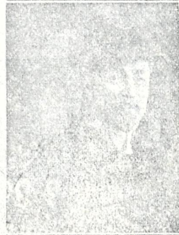
გ. ბ. გვა ვ ა ვ ა საქართველოს ეროვნულ საბჭოს წევრი და ქონებათა გამგე სექციის თავმჯდომარე

მაგრამ ბრძოლაში იცით ვინ იმარჯვებ? ერთ პირა მრავალხელა დაშქარი: მოხერხებული, შორს გამქვრეტი სარდალი და