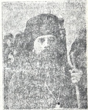
მირიან არქიმანდრიტი [დავით ბეჭატური] თავგამოდებული სამონასტრო მღვდელაწე, შობას არქიმან. აკურთხ.