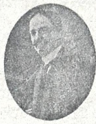
† გიორგი აბაშიძე (1870—1917)

გარდაიცვალა ხანგრძლივი ავადმყოფობის შემდეგ ქრისტე- შობისთვის 17. უმადლესი განათლებით აღჭურვილი ბი- რი იყო, თავგამოდებული მამულიშვილი, საზოგადო მო- ღვაწი. ნიჭიერი კრიტიკოს-პუბლიცისტი და საზოგადო მკურნალები, სოციალისტ ფედერალისტთა პარტიის ერთა შესწავლათაგანი, სსრკ-სთვის საზოგადო დაწესებუ- ლებათა მონაწილე სულის ჩამდგმელ და ამიერ-კავკასიის კომისარიატის წევრი. მისი ნაწერებისა მხოლოდ ორი ტომია გამოცემული. საქართველოს საზოგადოებრივ სა- სემწიფოებრივ ცხოვრებასა და მწერლობას თვალსაჩინო ძალა გამოაკლდა, რასაც გულის ტკიპით აღინიშნავთ. ხანგრძლივი იყოს ხსენება მისი! ვერცხლად შემდეგ.