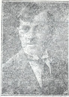
მსახიობი ალ. ალექსიძე (ქურდოვანიძე) გარდაცვალებიდან წლის თავის შესრულების გამო.

დროს უნდა გააგდებინოს კალამი ხელიდან, მსახიობიც, თუნდა გრიმის კეთების დროს, თუნდაც სადმე პროვინციის დაჩხარულ საპირფარეოში უნდა მიიცივლოს.