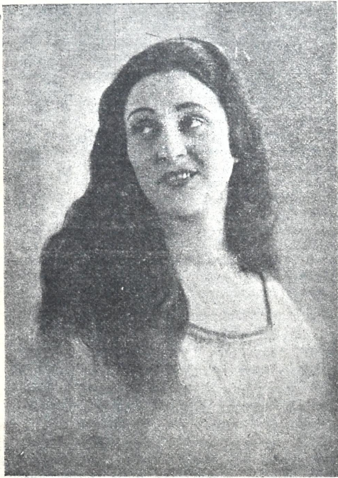
ქ. ჯაში—ჩკინის კოგორტა.

ეს დღეც გათენდა.. უფვე აღვსო მწარე ფილა ტანჯვა-ვნებასა, ზღვა ამობოქრდა და დასხვია ჩკინის ბორკილი მოთმინებისა. აქაღდე ნშეღმა და უ ყინარმა რისხვით და წურომით აღმართა ძალა, აქ ფუზული ზღვირითი ზღვირთსა ჰკრა, კლ ს მიაწყდა და გაიშალა. მლიქენელ მონებით ვარს მოხვეული მეფე შორიდგან ზღვის ვასტკერო და და მისი წურომა ღიმისა ჰკვირდა, ზღვის ძლიერება არა სჯეროდა. ანუ უფთხი, მეფევე, უთხონს მონებმა: „გვიბრძნე ერთგულთ და სიტყვის გამძლეეთ, რომ იოლელებულს ზღვის დაე წყარებთ, თავხედს სტიქონს აღვილად დაქძლევთ“.