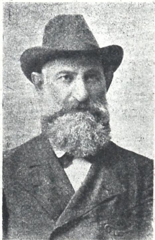
მ. პ. ი. ჩხიკვიშვილი. (1855—1924)

ღიღი ორიგინალი, არაჩვეულებრივი პიროვნება, განსაკუთრებული ხ.სათვის მკონე, ჯანმრთელი, ლამაზი, ახოვანი, ფრიად განათლებული, თავის ხელობის ჩინებულ ოსტატე, მინადირე, დაუცხრომელი ენერჯის პატრონი, ენა-შწარე, ნამდვილი ოთარაბათ ქე-ვი, სცენის მოყვარე, საზოგადო მოღვაწე, მედიცინის მასწავლებელი, ავადმყოფის უქანსკენელი იმედი,—ი ვინ იყო აწ გარდაცვალებული ყველასაგან საყვარელი ექიმი პოლიკარე ივანეს ძე ჩხიკვიშვილი.