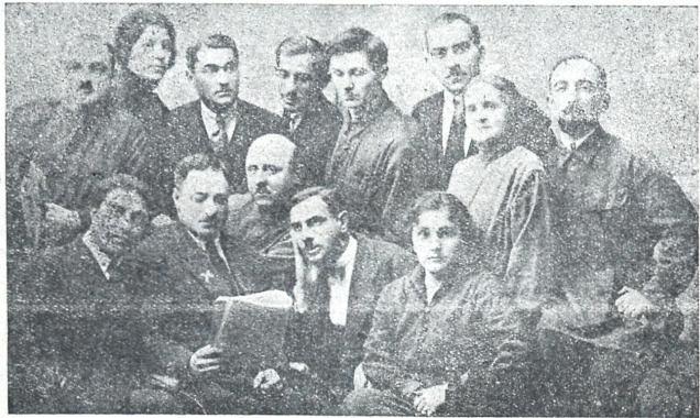
მოლიან მუშათა კოპერატივის ცენტრალურ სამმართველოსთან არსებული ქართული დრამატული დასი: