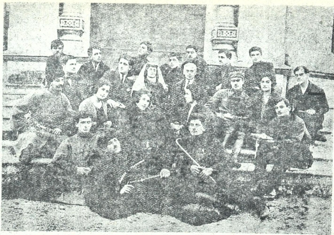
ბათუმის ცენტრალურ კლუბთან არსებული ქართული დრამატული წყა... ფიქციური ხელმწიფება.