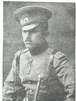
შ. დ. მ. შ.