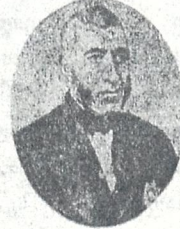
(გარდაცვალებიდან 40 წ. შესრულების გამო)

ვლადიმერ ეგ. იოსელიანი (1809—1875) ისტორიკოს-ფილოსოფოსი, ბატონიშვილების წინამძღვარის შვილი იყო. პირველდაწყებით სწავლობდა კალაგრაფ დავით რექტორთან, შემდეგ — იანე ნათლისმცემლის მონასტერში, 1817 წ. ახლად გახსნილ სემინარიაში შარველ მოწაფედ შევიდა, 1839 წ. ტატარებთან განაგრძო სწავლას პეტროგრადის სსს. აკადემიაში. 1831 წ. დაითავრა დუთის მეტ. კანდიდატის ხარის. 1835 წ. დაინიშნა სემინარიაში ფიზიკის, ფილოსოფიის და დუთის პეტრეველების მასწავლებლად. 2846 წ. დაიწყო „ამიერ კავკასიის უწყებათა“ (რუსულად) გამოცემა. 1850 წწ. დაინიშნა ქართულ მიუსკების ცენტრალად, ამავე ხანში მოიარა ათონი, მალესტინა და შეისწავლა იქაური ქართული პუგამენტები. მონაწილეობა მიიღო „ძველთა და ახალთა“ ბრძანებაში, მომხსნე ძველთა რაინდათა (გრ. ბრ. ბედიანის და სხ.) მოწინააღმდეგე იყო ახალთა (ილიასი, აკაკის და სხ.) გარდაიცვალა 1875 წ. 16 ნოემბერს და დიდის პეტავისცემით დაიკრძალა თბილისში. ნიჭიერად დაწერილი აქვს მრავალი ისტორიული შრომა: „მეფე გიორგი XII“, „ქართული საეკლესიო ისტორია“, „ქართული გრამატიკა“, ცნობილი წერილი რუსთაველის შესახებ, „თბილისის აღწერა“, „მოგზაურობა კახეთში“, „დიდი მოურავი“ (რუსულად). 50 წლებში აღწერა აუარებელი მონასტრები საქართველოში და სხ. გაზეთის ვარდა, გამოსცა „დიდმოურავიანი“, „იონას მიმოსვლა“, „არწილიანი“, ანტონ კათალიკოსის „წვთბილისიტეობა“, ჩხრუხაძის და შავეჯიას „თამარ მეფის შესახებ“.