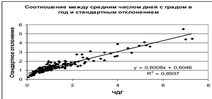
Рис. 1. Линейное корреляционное и регрессионное соотношение между средним значением ЧДГ и стандартным отклонением