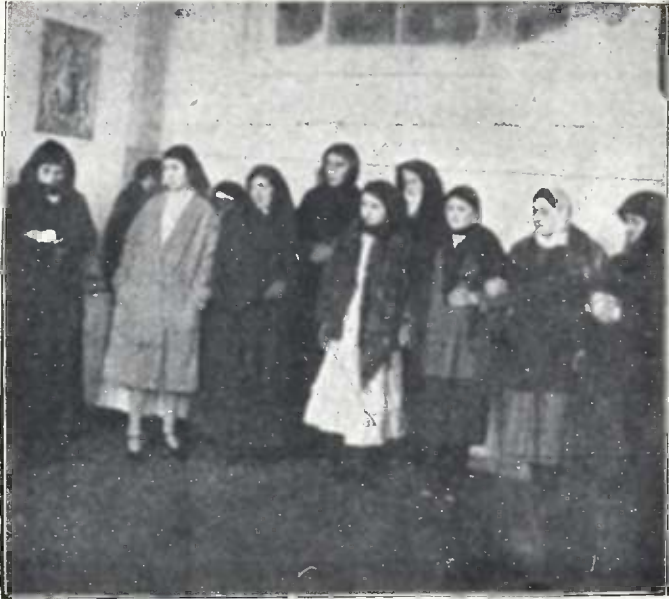
დეღეობის კალენდრის წიგნი