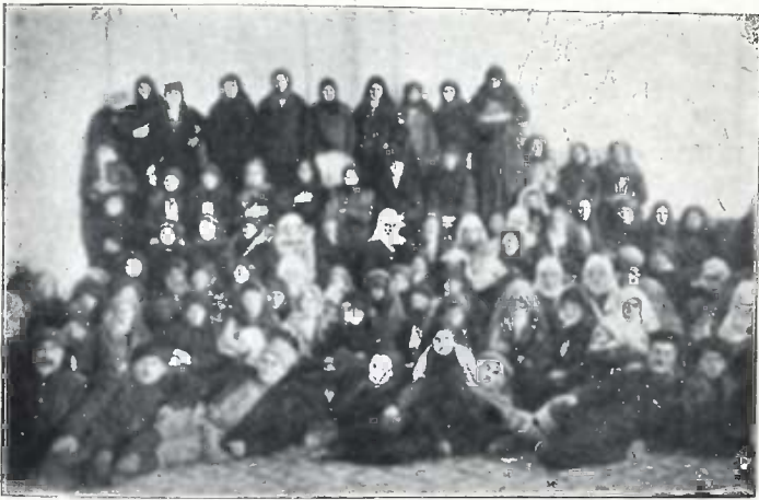
სულთს მუზის დემონსტრაცია