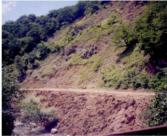
სურ.3. სოფ. ბაბის ხიდან 1994 წელს ჩამოსული მეწყრის კვალი და მდ. ძირულას გადარეცხილი უბანი.

წყალმოვარდნები ასევე დაკავშირებულია მცინვარების პულსირებასთან, რის შედეგადაც ხდებოდა და ხდება მდინარეთა ჩახერგვები. ამ შემთხვევაშიც გარღვევის და ნაზღვლევი წყალმოვარდნების ინტენსივობა სხვადასხვაა. მნიშვნელოვანია კლიმატური პირობები, კერძოდ: ატმოსფერული ნალექები. როდესაც ატმოსფერული ნალექების რაოდენობა დიდია წყლის დონე მატულობს და გარღვევის ალბათობაც უფრო მეტად იზრდება და პირიქით, როცა ნალექების რაოდენობა მცირეა, ჩახერგილი მასის გარღვევის შესაძლებლობა მცირდება. უკანასკნელის დროს შესაძლებელია იმ სამუშაოების ჩატარება, რომელიც აღმოფხვრის მოსალოდნელ კატასტროფას. საქართველოში ეს შემთხვევა ყველაზე კარგად არის გამოხატული მცინვარ დევდორაკის მაგალითზე. აქ წლების განმავლობაში ხდებოდა ასეთი კატასტროფები. შედეგებიც მუდამ უარყოფითი იყო. ამჟამად ამ ტერიტორიაზე მუდმივად მიმდინარეობს მონიტორინგი, არის სამეთვალყურეო საგუშაოები და დაკვირვებები, რათა დროულად მოხდეს წყალმოვარდნის თავიდან აცილება მცინვარის მოქმედების შემთხვევაში. [1,3,2,5].