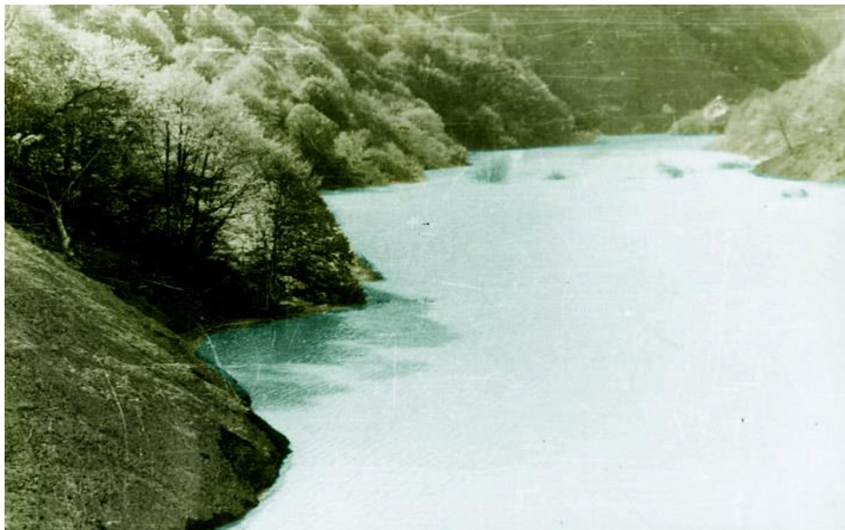
სურ.1. ხახიეთის დაგუბებული ტბა (1991 წ.)

ნაზღვლევი წყალმოვარდნის შემთხვევაშიც პირველი ფაქტორი ატმოსფერული ნალექებია, რომელიც იწვევს გარკვეულ გეომორფოლოგიურ ცვლილებებს. აქ იგულისხმება კლდეზვავების, მეწყერების, მყინვარების და ა.შ. ჩამოსვლა. მდინარის ხეობაში გარდა ამისა, მნიშვნელოვანია ნატანი მასალა, რომელიც კეტავს მდინარის კალაპოტს. გადაკეტვის ინტენსივობა და ხანგრძლივობა კი დამოკიდებულია ჩახერგილი მასის მდგარდობაზე. მაგალითად: თოვლის ზვავების შედეგად ჩახერგილი მასა მალე ირღვევა, ხოლო კლდეზვავით ჩახერგილი შეიძლება არ გაირღვეს წლების განმავლობაში მასის მდგარდობის გამო. ამის მაგალითია რიწის ტბა, რომელიც მრავალი წლის წინ ჩახერგა კლდეზვავის შედეგად, როდესაც მდ. იუფშარა გადაიკეტა კლდეზვავით. სამეცნიერო კვლევების საფუძველზე მეცნიერებმა გააკეთეს ანალიზი რომ მისი გაღვევის საშიშროება ფაქტობრივად არ არსებობს. იგივეს ვერ ვიტყვით მდ. ხახიეთისწყლის წარმოშობილ ტბაზე, რომელიც 1991 სურ.1 წლის მიწისძვრის დროს კლდეზვავის ჩახერგვის შედეგად ჩამოყალიბდა. კლდეზვავმა დამარხა სოფ. ხახიეთი და გადაკეტა მდ. ხახიეთისწყალი. [1,3,4].