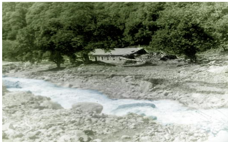
სურ.2. ხახითის ტბის გარღვევასთან დაკავშირებული წყალმოვარდნის შედეგები მდინარის მარჯვენა ტერასაზე სოფ. პერევაძე (1991წ. 16/05)

კაშხლის გარღვევამდე ატმოსფერული ნალექების დიდი რაოდენობა მოვიდა, დილით 23 მმ, საღამოს კი - 29-30 მმ. ამის შედეგად კაშხლიდან დაიწყო წყლის გადმოსვლა, თუმცა საბოლოოდ ბუნებრივმა კაშხალმა ვერ გაუძლო წყლის ნაკადს და გაირღვა. მას მოჰყვა ნაზღვლევი წყალმოვარდნა. სწორედ გარღვევის ადგილას იყო ყველაზე დიდი წყალმოვარდნის პიკი, ამალღებულ ადგილებზე 10-15 მ სიმაღლის ტალღებით. წყალმოვარდნამ 15-17 წუთში მიაღწია სოფ. პერევაძე, სადაც წყლის ნაკადმა დაანგრია ხეობის მიმდებარე ტერიტორიაზე არსებული ქარხნები და ხიდები, გაანადგურა სასოფლო სამურნეო სავარგულები, დაიღუპა ერთი ადამიანი სურ.2. [2,5,6]